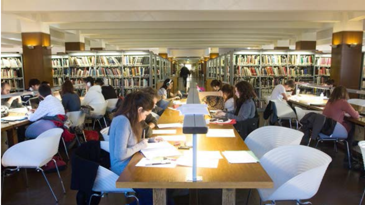
Figura 7. La universidad como espacio para la cooperación. Biblioteca General de la ETS de Arquitectura de la Universidad Politécnica de Madrid.

Histórico + cultural Iberoamericano". Compuesta en la actualidad por más de ochenta universidades de diecisiete países. Igualmente, su ITD, Centro de Innovación en Técnicas para el Desarrollo Humano, se ha convertido en un instrumento de cooperación transversal interna (Ver figura 7).