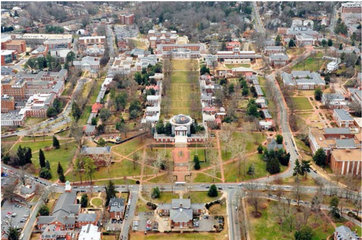
Figura 1. Vista aérea oblicua de la Universidad de Virginia, Monticello, EEUU.

La conmemoración de la Ciudad Universitaria de Madrid reclama, por tanto, innovar. Actualizar los valores destacados en su proceso fundacional hace un siglo como ciudad y campus desde las diversas instituciones y sedes que hoy la integran, con la colaboración estrecha entre la Universidad Complutense, la Politécnica de Madrid y la Nacional a Distancia. Sus 320 hectáreas comparten un variado inventario de instituciones de investigación, como son la Casa de Velázquez, el Museo de América, la Agencia Española de Cooperación Internacional para el Desarrollo, el Instituto del Patrimonio Cultural de España, además de hospitales públicos, organismos de investigación y especialización docente de diversas disciplinas, residencias estudiantiles y una gran parcela ocupada por la Presidencia del Gobierno Central. Todas ellas componen el complejo de instituciones aludidas por la declaración en estudio.