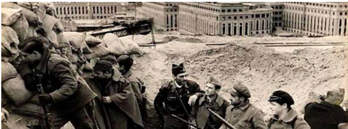
Figura 6. Fotografía de la batalla de Madrid en el recinto de la Ciudad Universitaria. Archivo fotográfico de la delegación de propaganda de Madrid durante la Guerra Civil (Archivo Rojo).

La posibilidad fue quedar reducido a un museo arqueológico. Pero tras un trienio de debates, con la evidente animadversión cultural del régimen político de la dictadura, se transformaría en reconstrucción bastante fidedigna debido a las carencias del país. Madrid fue una batalla que los sublevados del ejército franquista nunca ganaron, lo que permite apreciar en estas dudas de un primer momento, un cierto intento de castigo a la ciudad y al campus en particular. Se llegó a plantear el ser reutilizado, pero sólo para edificios de la Administración y que Madrid perdiera su condición de capital de España en beneficio de Sevilla.