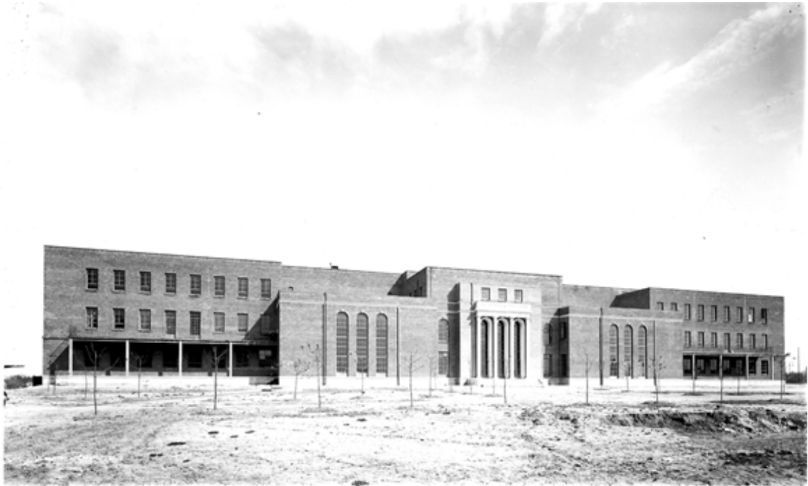
Figura 4. 1932, Instituto de Física y Química. Fundación Rockefeller hoy Instituto Rocasolano.

el "deco" que impregnó formalmente al proyecto universitario, del mismo modo que aportó la influencia moderna de Mies van der Rohe en el Instituto Tecnológico de Massachusetts. Por otro lado, la lejana Berkeley, en California, inspiró el tratamiento radical de la orografía de las fincas cedidas por la Corona. Es el momento del hormigón armado y de su eficacia estructural.