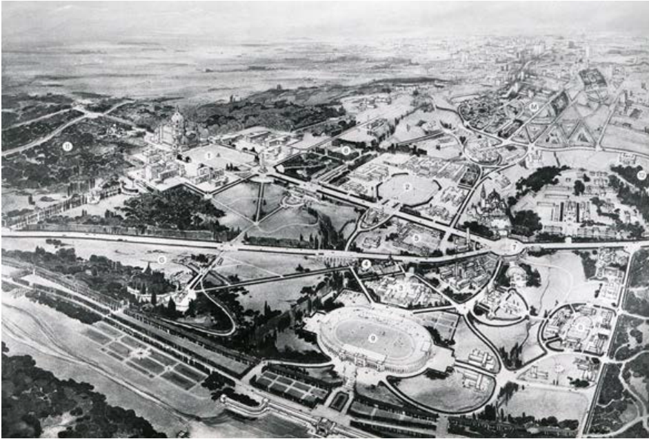
Figura 5. Dibujo hacia 1927 del conjunto proyectado para la Ciudad Universidad de Madrid.

La Ciudad Universitaria entonces fue también un escenario de construcción y destrucción. En este argumento de calidad edificatoria, indudable, se añade la ordenación general de 1927 (ver figura 5). La gran dimensión de su eje entre Ciudad y Naturaleza le hace perder intensidad a la unidad del modelo importado en beneficio de la coherencia por zonas. Cinco años después se inauguró la primera facultad, Filosofía y Letras, y tres años más tarde, ese mismo conjunto sufrirá, durante otros tres, el embate del ejército sublevado en su intento de ocupar la capital del Estado durante la guerra civil. Sus facultades se convirtieron en ruinas (ver figura 6)