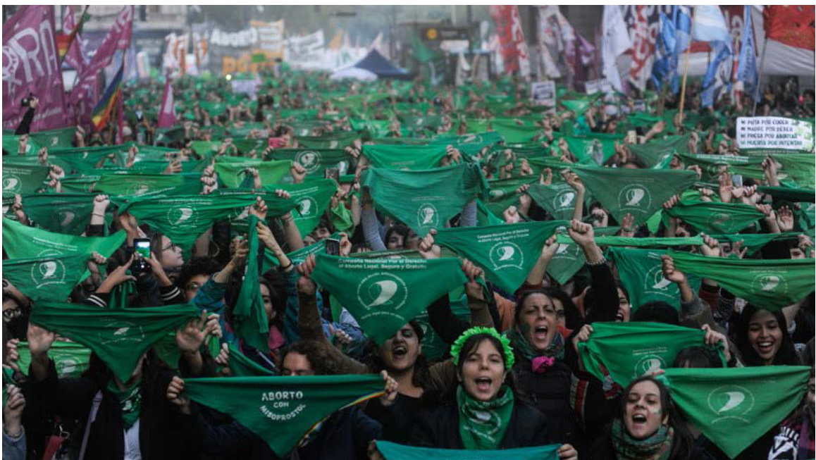
Figura 3. Marcha de mujeres en el Congreso de Argentina durante la presentación de la Ley de aborto. 28 de mayo de 2019.

Es en la ciudad - como "lugar de expresión política y como derecho a adquirir", como proceso de adquisición de libertad y proceso de individualización de la sociedad- el espacio (Lefebvre, 1976) donde miles de mujeres y diversidades salen hace décadas al espacio público a manifestarse contra la violencia machista, sobre todo en países del sur, cuna de esta cuarta ola de feminismo, para poner el debate público hacia una igualdad de género y pluralidad diversas (ver figura 3).