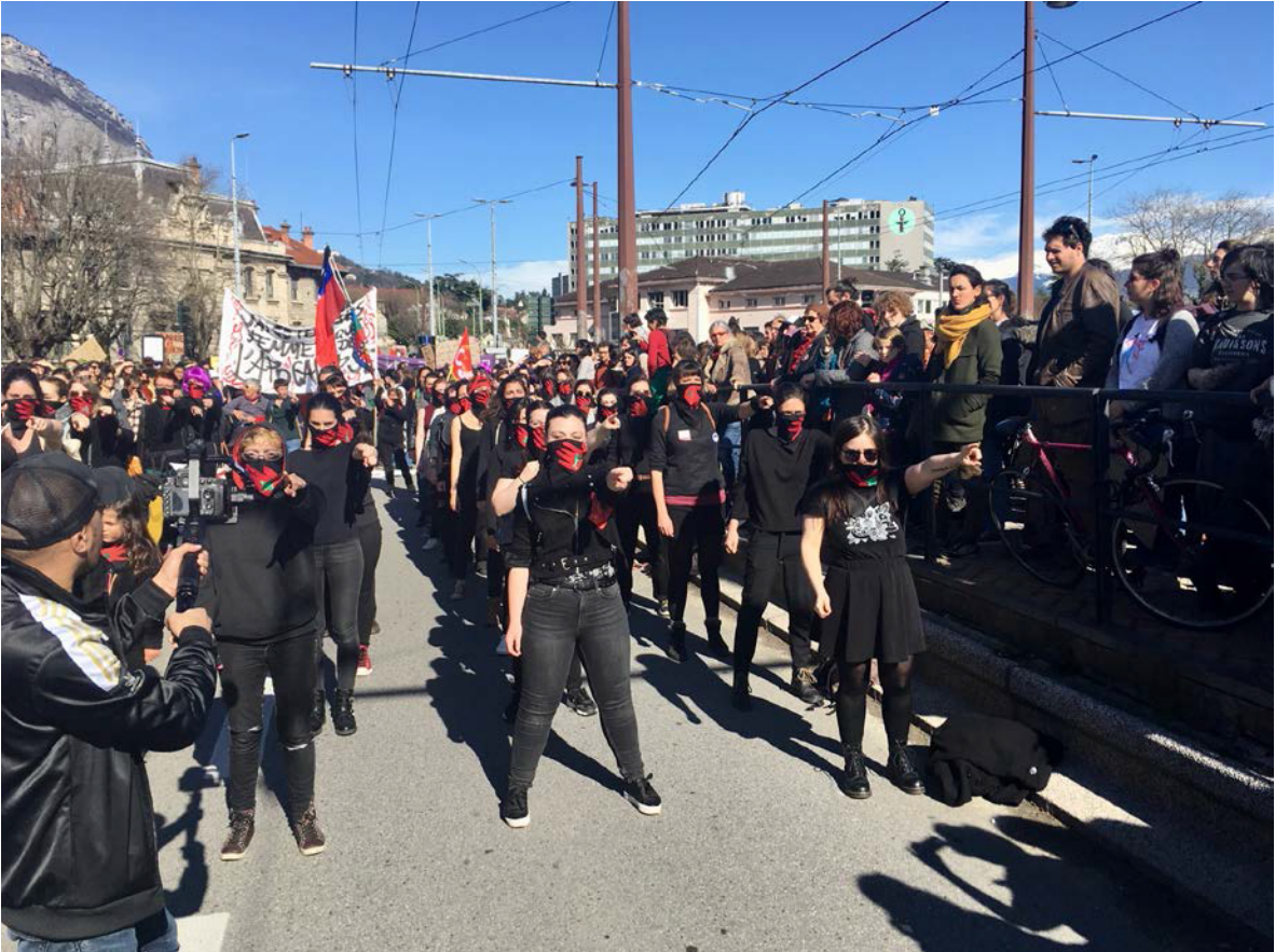
Figura 7. Marcha Conmemoración día de la Mujer 8M 2020, visión norte-sur Fuente:Fotografía de Iván Canales Grenoble, Francia 2020. Fuente: archivo personal.

vivir. De esta forma, ellas están luchando por adquirir otro tipo de libertades y explorando otros roles posibles en la expresión sobre su propio "derecho a la ciudad" (ver figura 7).