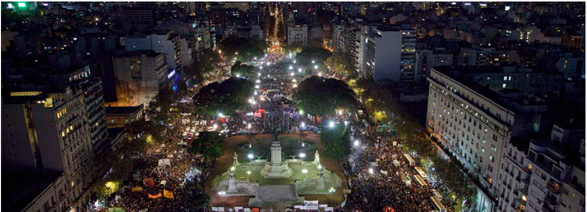
Figura 1. Imagen "Ni Una Menos" Argentina, ciudad Buenos Aires, 03 de junio 2015

eurocéntrico, en base a mujeres blancas, heterosexuales, de países del norte. No obstante, como lo señala Espinosa, "desde hace algunas décadas el feminismo latinoamericano viene desarrollando un pensamiento crítico y una política que intente tomar en cuenta las desigualdades de raza y clase en que vive un porcentaje importante de las mujeres de la región" (2014, p. 309).