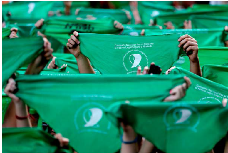
Figura 4. Marcha por el aborto en Buenos Aires, Argentina. Abril 2018. Fuente: Natacha Pisarenko. Archivo personal de la autora.

Para dar cuenta de este mecanismo se explicará brevemente a continuación el caso del movimiento feminista argentino "Ni Una Menos" y la campaña para el "Aborto, Legal, Seguro y Gratuito" (ver figura 4).