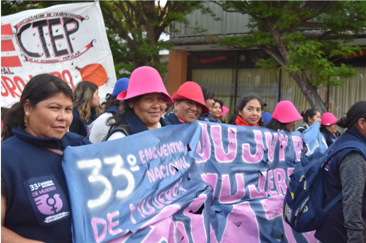
Figura 6. Marcha en el 33 Encuentro Nacional de Mujeres ciudad de Trelew, provincia de Chubut Argentina, octubre 2018.