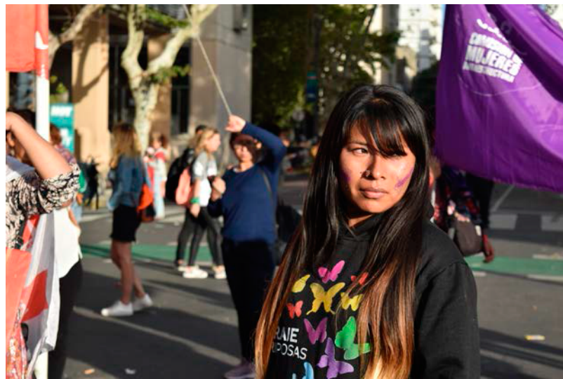
Figura 2. En marcha "8M" Argentina, ciudad La Plata, 08 de marzo 2019.

oportunidades para mujeres y diversidades. En la base de las reivindicaciones de estos (ver figura 2) movimientos feministas están presentes las fuertes desigualdades en la división de las tareas productivas y reproductivas.