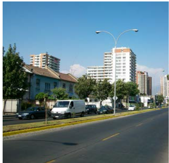
Figura 1. Aumento de la edificación en altura en la avenida Irrazábal (Zona 1).

Para entender ese espacio de incertidumbre en la aplicación de la normativa se presenta un caso asociado a la construcción de la edificación en altura y la participación de un grupo de acción ciudadana local en la aprobación del Plan Regulador Comunal de Ñuñoa entre 2004 y 2007. En ese momento, se buscaba aumentar la densidad del área municipal en cumplimiento al Plan Intercomunal de Santiago de 1994 y frente a una oposición ciudadana potente. Debido a un aumento notoria de la altura de edificación entre 2004 y 2006 (ver figura 1) distintos grupos ciudadanos se organizaron, dando a conocer su descontento en los medios de comunicación locales y nacionales. Colectaron firmas en las plazas locales exigiendo una moratoria respecto a la aprobación de edificación en altura sobre los cuatro pisos y una discusión ciudadana amplia del plan (Aguirre y León, 2007). Aunque el caso habla sobre un Plan Regulador Comunal, el enfoque del estudio no está ahí sino en la aplicación creativa y selectiva de otro instrumento normativo - la Ordenanza General de Urbanismo y Construcciones (OGUC) - necesario para aprobar al Plan Regulador Comunal nuevo.