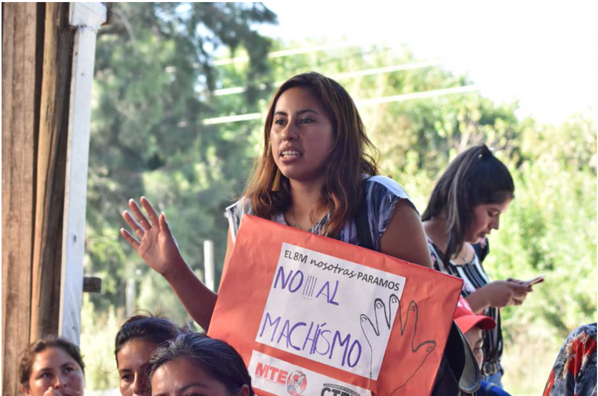
Figura 5. Taller preparatorio sobre el trabajo no remunerado de las mujeres en el campo y en la casa de Marcha “8M” Argentina, ciudad La Plata, 8 de marzo 2019

Encuentros Nacionales de Mujeres (ENM), estos son espacios donde durante tres días las mujeres y disidencias de Argentina y de países del sur se encuentran para discutir políticamente bajo los principios de “autogestión, autonomía, horizontalidad, democracia, auto convocatoria y autofinanciamiento” (Alma y Lorenzo, 2009, p. 42). Estas experiencias populares surgieron en la década del 90 y tuvieron como resultado “el traslado de la política al territorio, ocupando el espacio público como foro de debates, discusiones, propuestas y reclamos” (Alma y Lorenzo, 2009, p. 31). Desde 1986 se realizan anualmente los ENM, en Argentina, un proceso poco documentado al respecto (ver figura 5). Las estrategias y discurso de las ENM han sido una base importante en las prácticas dentro del movimiento feminista contemporáneo de “Ni Una Menos” (Di Marco, 2003, citado por Alma y Lorenzo, 2009, p. 32).