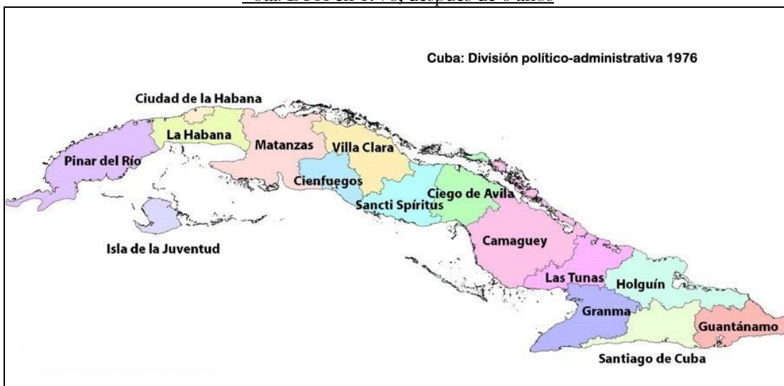
Mapa No.6. 6ta. DPA en 1976, después de 6 años

Esta DPA multiplicó la antigua provincia de Oriente por cinco: Guantánamo, Santiago de Cuba, Granma, Holguín y Las Tunas. Camagüey cedió parte de su superficie a la nueva provincia de Ciego de Ávila. La provincia de Las Villas pasó a llamarse Villa Clara y disminuyó su territorio en favor de la