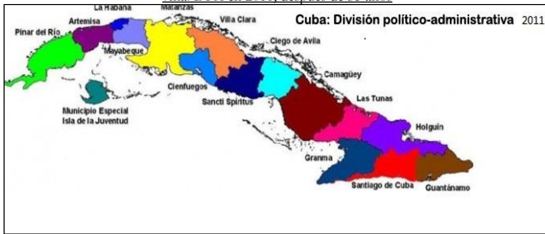
Mapa No.8. 7ma. DPA en 2011, después de 35 años

Al tratarse de un proyecto que modificó la Ley 1304 de julio de 1976, se sometió a la consideración de los diputados y se aprobó en un Periodo Ordinario de sesiones de la Asamblea Nacional del Poder Popular.