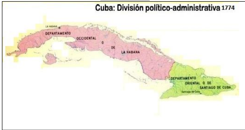
Mapa No.1. 1ra. DPA en 1774

En el Mapa No.1 se aprecia que la isla comprendía solo dos departamentos: el Oriental o de Santiago de Cuba, con sede en esa ciudad (en el territorio que hoy ocupan las cinco provincias orientales) y el Occidental o de La Habana (desde las actuales provincias de Pinar del Río hasta Camagüey), incluida la entonces Isla de Pinos, con cabecera en la Villa de San Cristóbal de La Habana, convertida en capital floreciente.