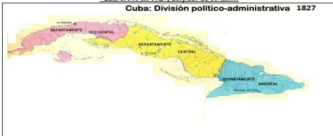
Mapa No.2. 2da. DPA en 1827, después de 53 años.

La evolución histórica de DPA denota una estrecha relación con la demografía; pues en la medida en que el país ha crecido en población se han tenido que ajustar las estructuras territoriales de la época. Otras dos divisiones tuvieron lugar durante el siglo XIX. La primera, después de 53 años, en 1827 los departamentos se convirtieron en tres: el Oriental que conservó básicamente la misma superficie, mientras el Occidental abarcaba la geografía comprendida hoy de Pinar del Río a Matanzas, más la Isla de Pinos.