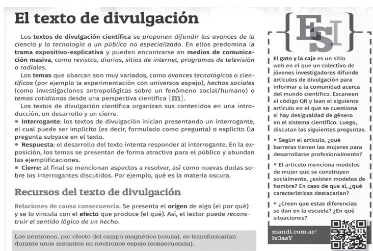
Figura 1. Lengua y Literatura 2. Prácticas del Lenguaje 1.º/2.º. Serie Llaves más Estación Mandioca (2019: 149) 11 .

El libro de Lengua y Literatura está dividido en tres bloques: “Ámbito de la literatura”, “Ámbito del discurso” y “Reflexión sobre la lengua”, en línea con los diseños curriculares. En el primer bloque aparecen seis plaquetas “ESI”, una por capítulo, asociadas a los textos que se trabajan en cada uno. En el segundo bloque hay cinco plaquetas, también una por capítulo, a excepción del último (“El debate”). En cambio, resulta llamativo que no aparezca ninguna de estas plaquetas en el bloque “Reflexión sobre la lengua”. Las plaquetas se ubican en las páginas de teoría sobre el género discursivo o tipo textual trabajado en los capítulos, como se puede observar en la siguiente imagen: