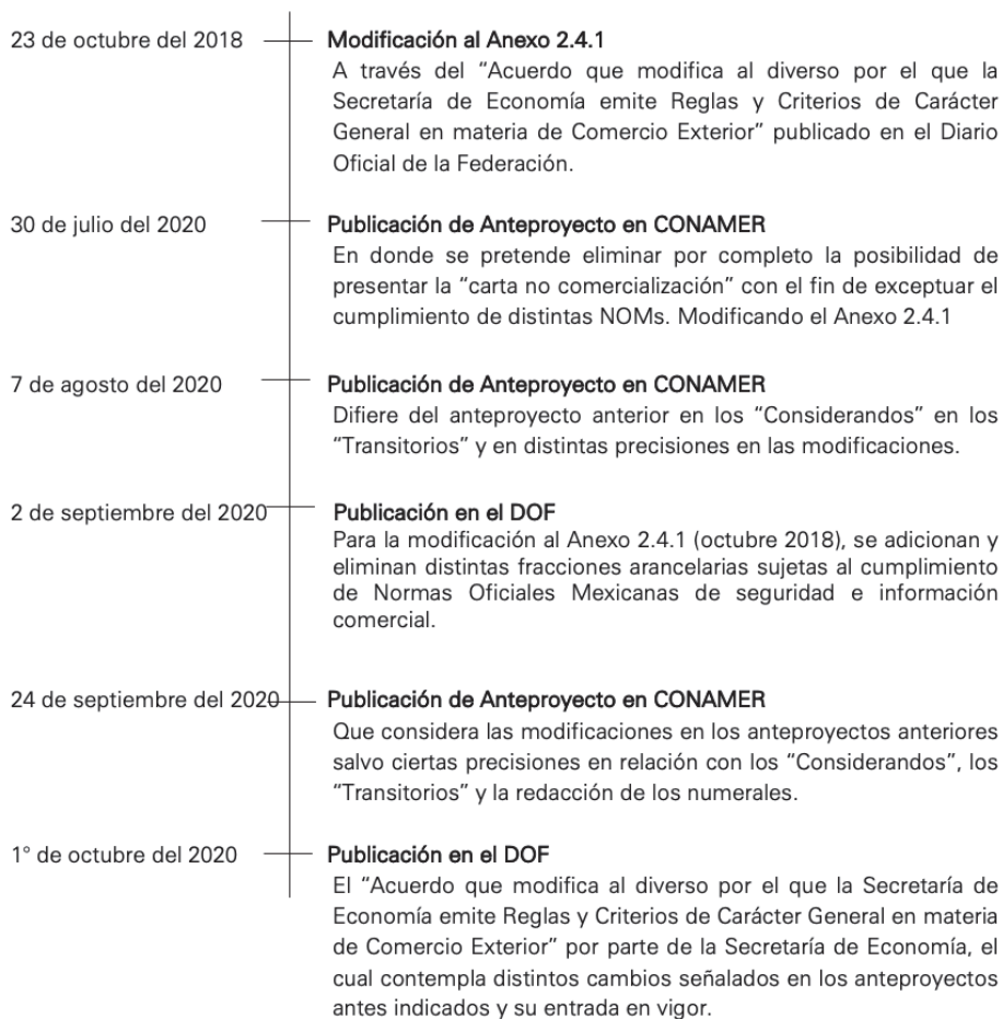
Figura 3: Modificaciones importantes.

Por último, el 1 de octubre de 2020 se publicó en el DOF el Acuerdo que modifica al diverso por el que la SE emite Reglas y Criterios de Carácter General en materia de Comercio Exterior, por parte de la SE, el cual contempla distintos cambios señalados en los anteproyectos antes indicados. Uno de los cambios más relevantes para la presente investigación, fue la eliminación de las fracciones VII, VIII y XV del numeral 10, es decir, se anuló la posibilidad de presentar la “carta de no comercialización” para exceptuar el cumplimiento con las NOMs.