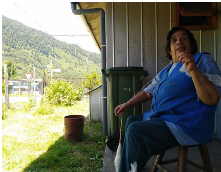
Imagen 7: Señora Bernardita hilando

La constante retroalimentación e interacción entre identidad y naturaleza se vio reflejada nuevamente en la elaboración a partir de materias primas y el oficio de artesanas. La relación con el entorno natural de las mujeres es -de forma consciente o no- ejercida constantemente por el de oficio artesanas, donde la elaboración de sus productos se basa en la utilización de elementos extraídos de la naturaleza, lo que conlleva un conocimiento heredado y profundo sobre las materias primas extraídas del entorno, destacando la importancia de la naturaleza como escenario para el proceso creativo en la elaboración de sus productos.