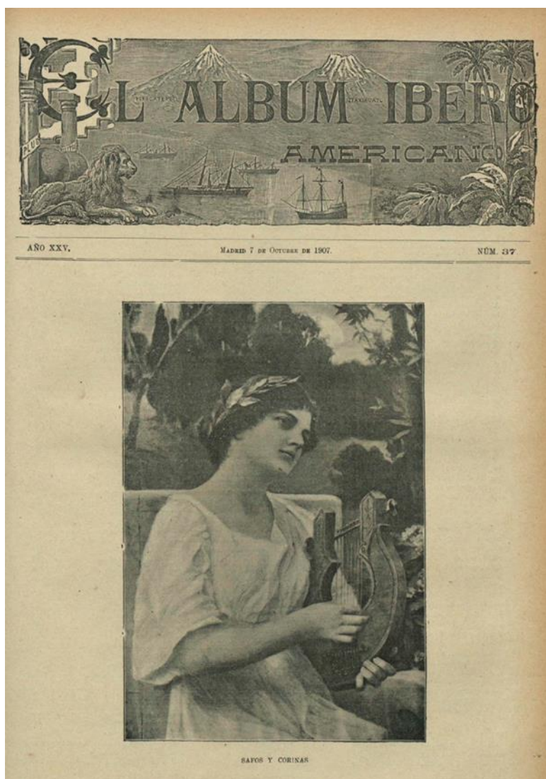
Fig. 2. El Álbum Ibero americano.

Además, son numerosos los artículos en los que también aludió a ellas. La duquesa de la Torre era una “belleza sin ocaso, como lo fueron Livia en Roma, Deidama en Sciros, Policena en Troya, Aspasia en Atenas, y en Francia Diana de Poitiers” 82 , y las mujeres romanas y espartanas podían traerse a colación hablando de las mexicanas o de la maternidad 83 , siempre destacando la valía femenina, en muchas ocasiones enfrentada a la masculina. Por ejemplo, en uno de sus artículos