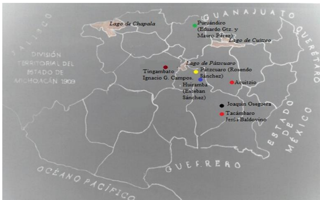
Mapa de los contrarrevolucionarios armados delatados por Steimann en 1912 22 .