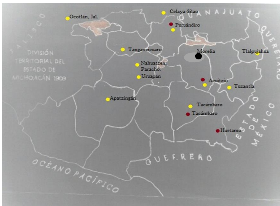
Mapa de rebeldes en el estado y ciudades circunvecinas, entregados en 1912 por C. Steimann 37 .