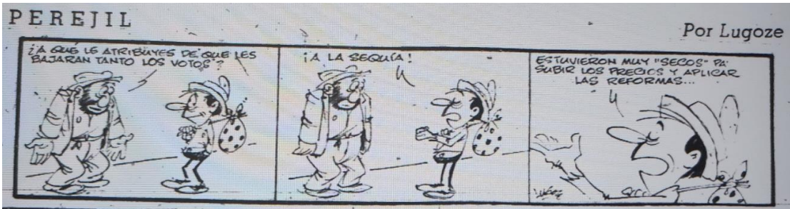
El Mercurio, 4 de marzo de 1969, página 15.

Convencido del rechazo que genera la figura de Chonchol, El Mercurio se burla de su eventual precandidatura presidencial en la imagen 15 y no olvida sus posiciones reformistas. Haciendo referencia al plato de “chunchules” Perejil afirma que el ex funcionario del Instituto de Desarrollo Agropecuario (INDAP) “a la mayoría le cae pesado”. Nuevamente los usos alimenticios del pueblo son usados como estigmas para desacreditar las posiciones políticas en juego y, de paso, reafirmar el clasismo en que se sostienen las clases privilegiadas chilenas. Los chunchules – palabra quechua – corresponde a los intestinos del animal.