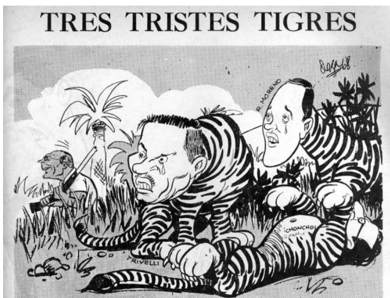
Topaze, 22 de noviembre de 1968, página 15.