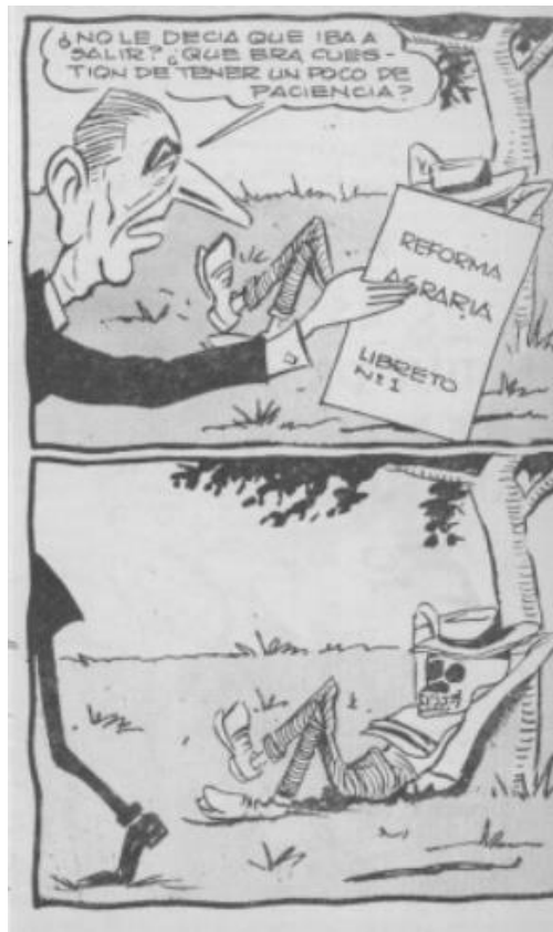
Topaze, 26 de noviembre de 1965, página 9.