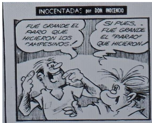
El Siglo, 14 de mayo de 1970, página 1.