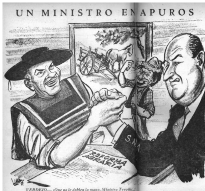
Topaze, 16 de noviembre de 1964, páginas 14 y 15.

No obstante, un año después, la heroica figura de Frei Montalva es criticada por la tardanza en la promulgación de su proyecto. Como se aprecia en la imagen 12, un campesino se ha convertido en esqueleto esperándolo. Es un llamado a acelerar el tranco. Durante esta tramitación y la aplicación de la ley vigente, las críticas de Topaze también van a la izquierda.