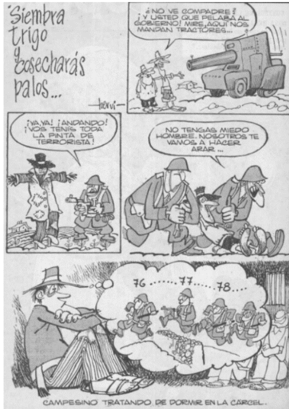
Topaze, 9 de agosto de 1968, página 2.

En la imagen 20 se ve a Chonchol representado como un tigre baleado por el Ministro del Interior, Edmundo Pérez Zujovic. Le acompañan el Ministro de Agricultura, Hugo Trivelli y el vicepresidente ejecutivo de la CORA, Rafael Moreno. La disputa al interior del gobierno la ganó Zujovic y las cabezas de la Reforma Agraria lo lamentan. La diferencia de fuerzas entre el cazador y un tigre es evidente. Tal es su inferioridad que reciben el apelativo de tres tristes tigres. El uso de un arma y una bala no es algo fortuito. Pérez Zujovic es el representante de la “mano dura” en el gobierno. La revista satírica, muestra la crudeza de la “interna” de la DC y su cierre a las posiciones más izquierdistas. Al término de su existencia de cuatro décadas, Topaze termina por dejar la crítica a Chonchol y redirigirla a los sectores conservadores del partido gobernante.