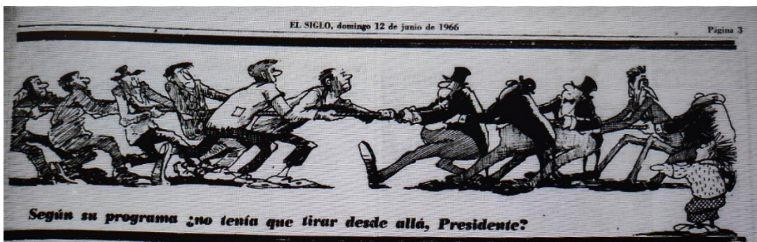
El Siglo, 12 de junio de 1966, página 3.

En el caso de Topaze, el medio toma partido por el gobierno de Frei y su proyecto de reforma, criticando a la derecha y a los latifundistas por oponerse y a la izquierda por querer radicalizarlo.