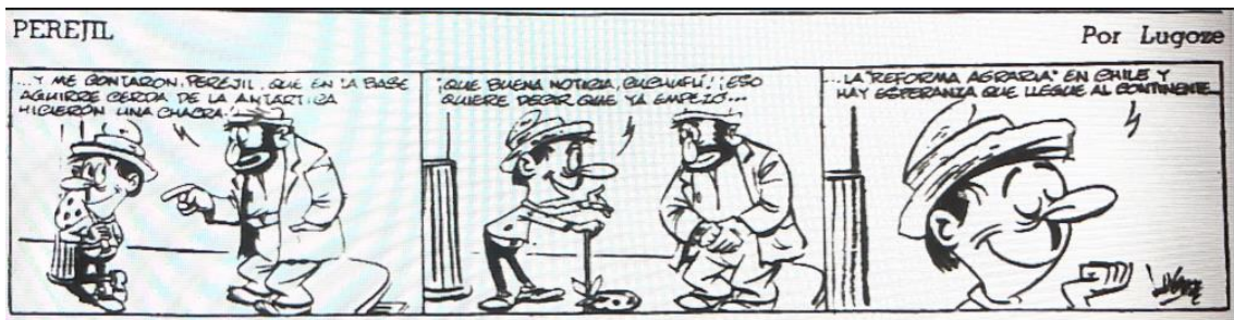
El Mercurio, 1 de julio de 1962, página 20.