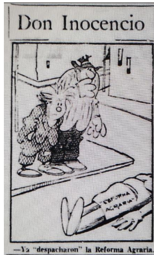
El Siglo, 21 de noviembre de 1962, página 4.