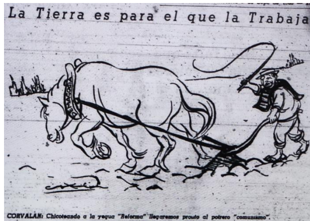
El Mercurio, 7 de septiembre de 1966, página 27.

El Siglo cuestiona esos acuerdos y se manifiesta partidario de medidas más profundas, que permitan expropiar más tierras. La imagen 10 representa el típico juego de la cuerda. De un lado, trabajadores, flacos y con ropas raídas, y del otro, hombres de frac, muchos de ellos robustos, identificados como grandes propietarios. Eduardo Frei se encuentra de este lado e Inocencio le recuerda que según su programa debería estar del otro. Desde la perspectiva comunista en el juego de poder no hay espacio para “el centro”. Frei no sólo ha elegido el bando contrario, sino que ha traicionado su programa. Sin embargo, se encuentra contrariado una vez que Inocencio lo recrimina. El periódico estigmatiza a Frei por no aplicar el programa, dejando el mensaje implícito que su sector sería el único que se mantiene fiel a las ideas de transformación.