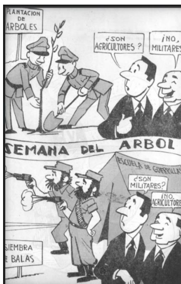
Topaze, 5 de junio de 1970, página 31.

El semanario seguirá mostrando simpatías por el gobierno, aunque más abierto a exponer sus contradicciones y problemas. En la imagen 19, se retrata una serie de situaciones vividas por los campesinos en el contexto de la represión de Carabineros. Topaze ridiculiza el hecho de que el gobierno responda a las necesidades del campo con fuerzas de orden y seguridad y la forma desmedida de la fuerza empleada. Vale apuntar que el gobierno de Frei Montalva será manchado por varios hechos de violencia en contra de movilizaciones populares, siendo las más importantes las Masacres de El Salvador y Puerto Montt, y la represión al Paro Nacional del 23 de noviembre de 1967. Bajo ese marco, la decisión de actuar fuera de los marcos legales suponía una decisión de alto riesgo para los campesinos. En este tema, la revista marcó una clara distancia con el gobierno de Frei.