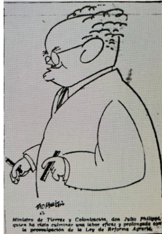
El Mercurio, 2 de diciembre de 1962, página 25.

En el caso de El Siglo, predomina la crítica a la insuficiencia del proceso reformista. Se busca transmitir un sentimiento de indignación con lo que ocurre en el parlamento y que el contenido de la ley no representa la demanda de una verdadera Reforma Agraria. Así, Inocencio, personaje protagónico de las “Inocentadas”, constata que, una vez promulgada la reforma en noviembre de 1962, la ley ha sido “despachada”: La Reforma Agraria, representada en el cuerpo de una mujer que yace tendida en el suelo, ha nacido muerta (Imagen 3). Y aunque la posición pasiva de los personajes alude a que ha sido un proyecto que se ha tramitado fuera de su alcance, su insuficiencia es un llamado implícito a luchar por una verdadera reforma del campo.