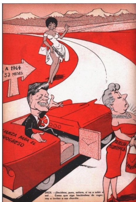
Topaze, 29 de diciembre de 1961, sin número.

La representación caricatural refleja las tensiones ideológicas en la derecha chilena. Muchos dirigentes de los partidos Liberal y Conservador provenían de una larga tradición cultural, donde los latifundios funcionaban como plataformas de prestigio social y fundamento de sus carreras