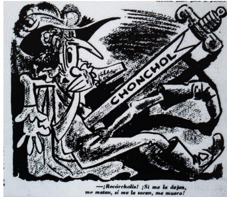
El Siglo, 7 de enero de 1968, página 25.

Si para El Siglo los latifundistas causan indignación y la DC decepción, la movilización de los campesinos es objeto de celebración. En la imagen 17 el periódico se regocija del paro campesino de mayo de 1970. Los personajes muestran asombro y contento con la movilización. Inocencio, remarca la idea aludiendo al "parao", o higa, que los campesinos le habrían hecho, se subentiende, a la patronal y el gobierno. De cara a las elecciones de septiembre de ese año, la fortaleza del paro muestra el descontento por parte de los campesinos con la aplicación del gobierno de Frei de la Reforma Agraria. La alegría trae consigo esperanza por el devenir de la lucha campesina y los resultados de la elección de Allende.