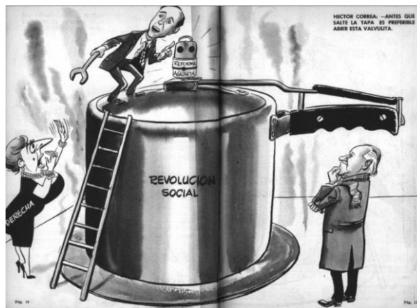
Topaze, 21 de julio de 1961, páginas 10 y 11.