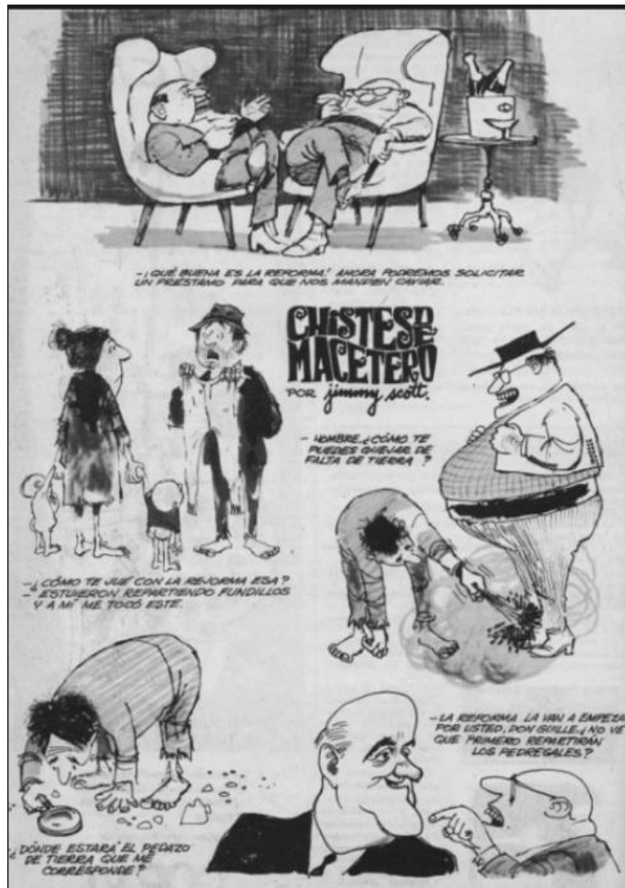
Topaze, 10 de agosto de 1962, página 8.