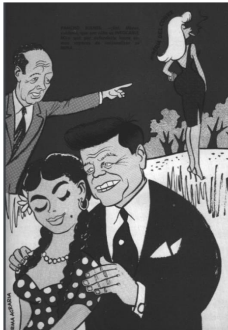
Topaze, 7 de julio de 1961, sin número.

Los caricaturistas cuestionaron el carácter acotado de la “reforma de macetero”. Un buen ejemplo es la Imagen 8, que vaticina un futuro frustrante para la Reforma Agraria, pues no se