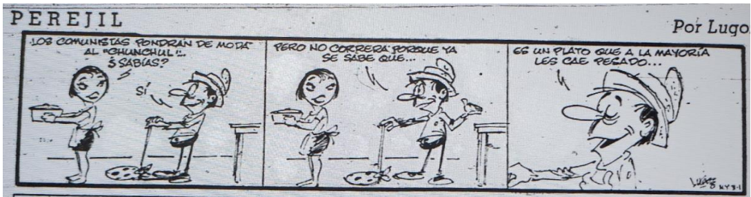
El Mercurio, 17 de marzo de 1969, página 19.

En el Siglo las tintas también se cargan al gobierno, pero no dejan de criticar a los grandes propietarios y defender la movilización de los campesinos. Asimismo, recogen la tensión al interior de la DC a propósito del actuar de Jacques Chonchol. La imagen 16 muestra al presidente Frei atravesado por una espada con el nombre de Chonchol y dice “¡Si me la dejan, me matan, si me la sacan, me muero!” En ese entonces, la renuncia de Chonchol es un tema candente al interior de la Democracia Cristiana y, el callejón sin salida al que alude El Siglo, indica que el presidente pretende conciliar, de manera imposible, los llamados de su partido y quizás las fuerzas de derecha a prescindir de Chonchol con la percepción de que el avance de la Reforma Agraria sostiene su popularidad, de modo que si acepta la renuncia el gobierno corre peligro. Es otro tema, pero la idea de fondo se mantiene, para el periódico comunista no existen medias