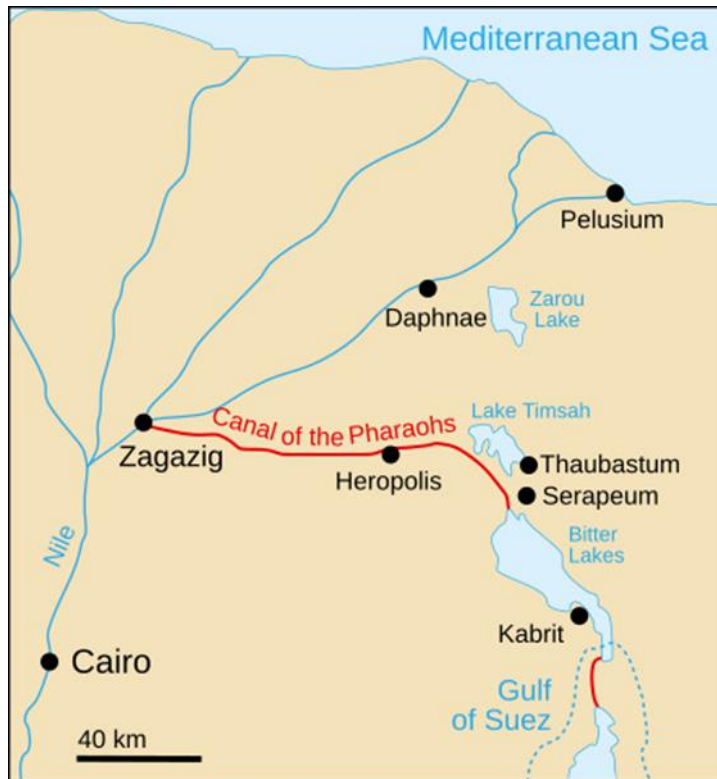
Imagen 4 (canal del wadi Tumilat o “de los Faraones”).

Unas décadas después de la redacción de la Corografía de Mela, el emperador Trajano volvió a abrir el canal, reacondicionándolo para la navegación; de hecho, el optimus princeps mostró un gran interés por reabrir el que a partir de entonces fue conocido como el Potamos Babylonos o Amnis Traianus 24 .