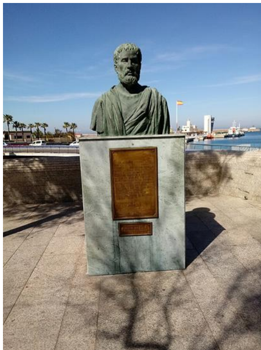
Imagen 1 (Busto moderno de Pomponio Mela, expuesto en la ciudad de Ceuta).

A esta problemática debemos añadir el hecho de que se desconoce cuál fue la finalidad exacta de la Corografía 8 . ¿Se trató de una especie de manual o texto escolar de geografía o era tan solo la creación, ideada para un reducido grupo de admiradores, de un diletante bastante erudito y que dominaba la prosa latina?