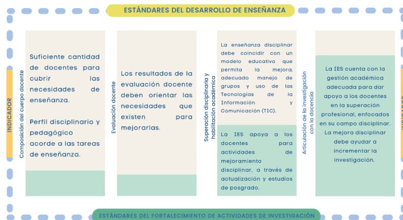
Figura 1. Indicadores y Estándares de la categoría Personal Académico CIEES