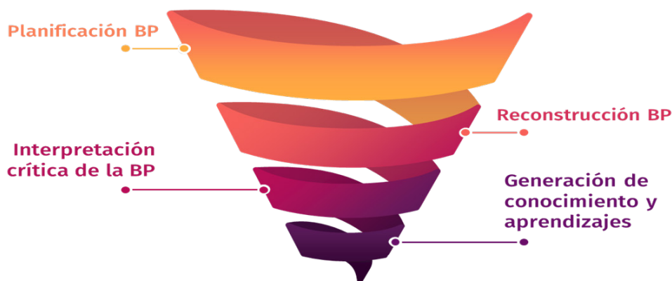
Figura N° 1. PDT Nariño. Proceso de sistematización de la Buenas Prácticas (BP)

El presente artículo se inscribe en la fase de potencialización de la experiencia. Para ello se tomó como base analítica la sistematización las siete buenas prácticas priorizadas. En simultaneidad, fue necesario la revisión de informes y documentos técnicos (planes de acción