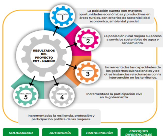
Figura N°3: PDT Nariño-Marco de actuación.

Por otro lado, el fomento de la cultura de emprendimiento en la educación mediante el de-