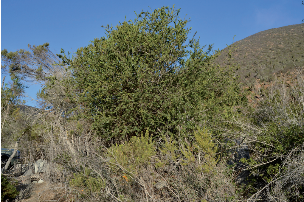
FIGURA 1. Monttea chilensis en Quebrada El Maray, Región de Coquimbo, Chile.