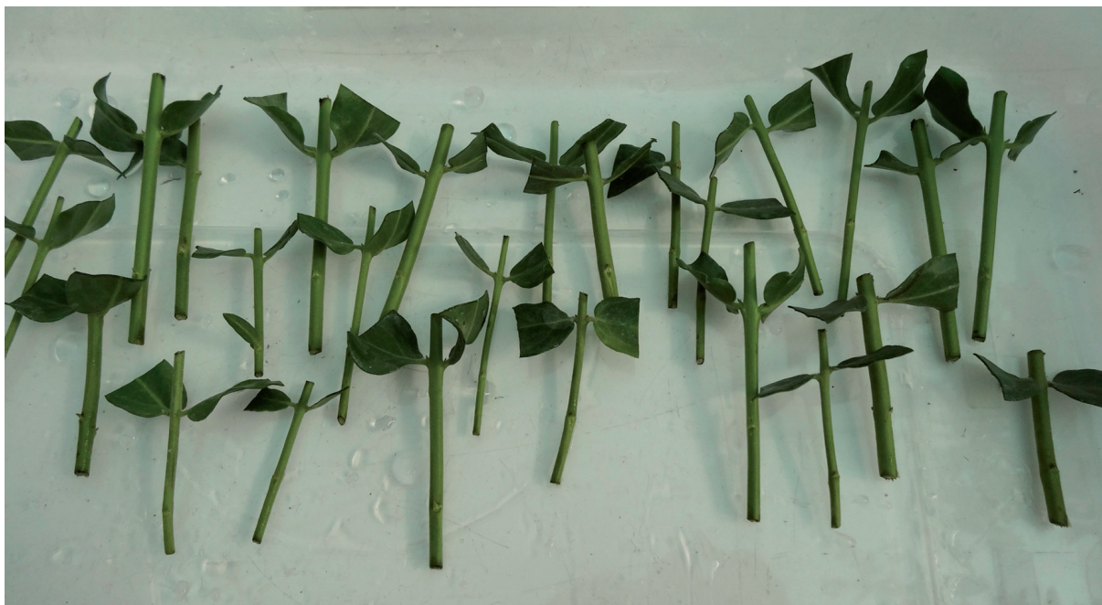
FIGURA 2. Esquejes binodales de Monttea chilensis utilizados para ensayos de enraizamiento.

Dada la ausencia de respuesta al tratamiento hormonal se diseñó y realizó un segundo experimento con tratamientos en dosis inferiores de la misma hormona (400, 800 y 1500 ppm), pero esta vez utilizando una solución acuosa para evitar un posible efecto fitotóxico por causa del alcohol, asegurando una buena dilución mediante agitación.