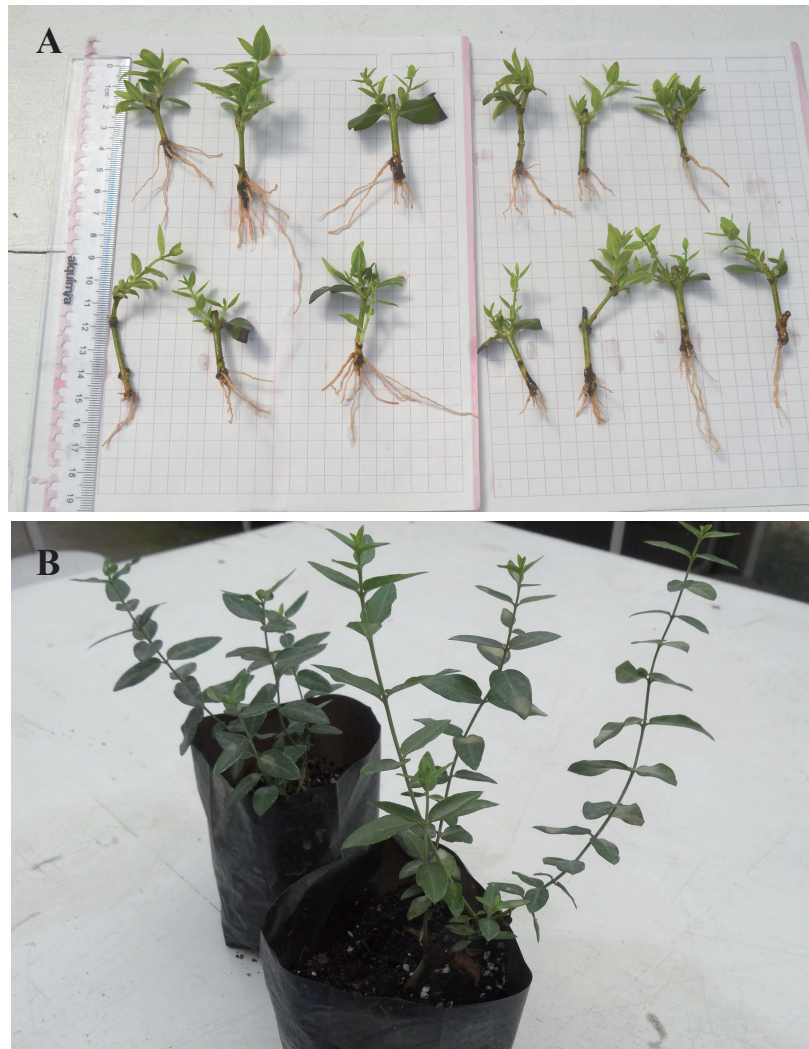
FIGURA 4. A. Enraizamiento de esquejes de Monttea chilensis del tratamiento testigo (sin AIB), a los 79 días de observación. B. Plantas obtenidas de esquejes, después de 7 meses de enraizamiento.