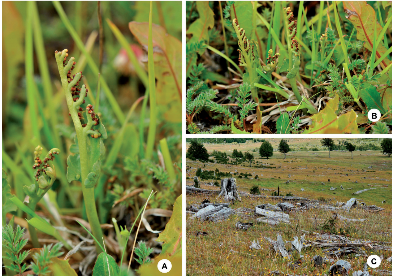
FIGURA 2. Botrychium dusenii : A. Planta, B. Individuos en praderas abiertas dominadas por un estrato herbáceo, C. Hábitat en su límite norte.