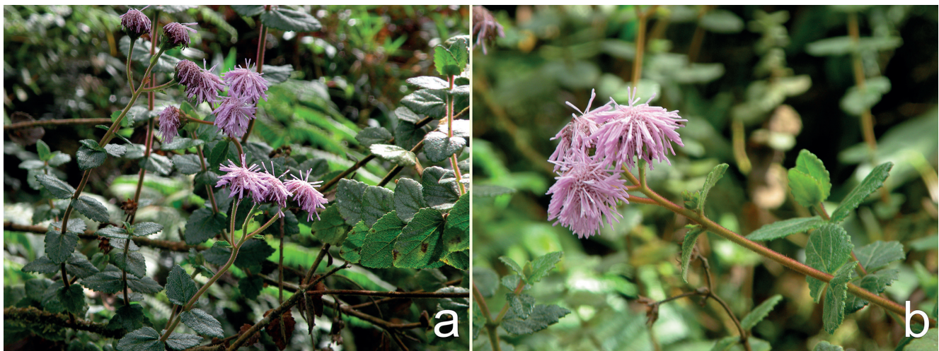
FIGURA 1. Ageratina neblinensis . a. Ramas con las inflorescencias; b. Detalle de una inflorescencia con las ramas estilares patentes en las flores. / Ageratina neblinensis . a. Branches with several inflorescences; b. Detail of an inflorescence showing the spreading style branches in its flowers.

Las especies más relacionadas con A. neblinensis son A. chachapoyasensis y A. wurdackii , conocidas también del norte del Perú (Brako & Zarucchi 1993). Con A. chachapoyasensis comparte corimbos con pocos capítulos, láminas de las hojas de ovadas a cordadas y los aquenios con algunas setas sobre las costillas; en cambio, con A. wurdackii , corimbos con pocos capítulos y hojas sésiles. A. chachapoyasensis destaca por sus flores con corola púrpura y hojas con largos pecíolos, mientras que A. wurdackii por corolas blancas y hojas con lámina elíptica. Aunque A. cutervensis (Hieron.) R.M. King & H. Rob. pertenece al subgénero Ageratina , sus hojas coriáceas, con láminas de ovadas a deltoides y subsésiles, se asemejan a las de A. neblinensis , del subgénero Andinia . El hecho de que A. cutervensis muestre semejanzas con especies del subgénero Andinia ya fue resaltado por Robinson (1926) al describir Eupatorium piurae ( A. piurae ), aunque ésta es muy diferente a A. neblinensis por presentar hojas claramente pecioladas, inflorescencias policéfalas, densas, y flores con corola blanca.