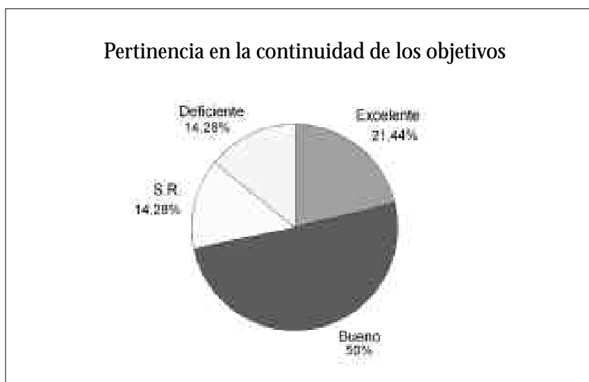
Gráfica N° 2.

tos duraderos después de haberse terminado; en este indicador se obtuvo como resultados en un 100% que los objetivos son y siguen siendo socialmente significativos y pertinentes; según se aprecia en la Gráfica N° 2, las instituciones consideran que los objetivos son y siguen siendo excelentes en un 21,44%, bueno en un 50%, es decir, el 71,44%, los evalúa pertinentes y sólo un 14,28% evalúa su continuidad de forma deficiente.