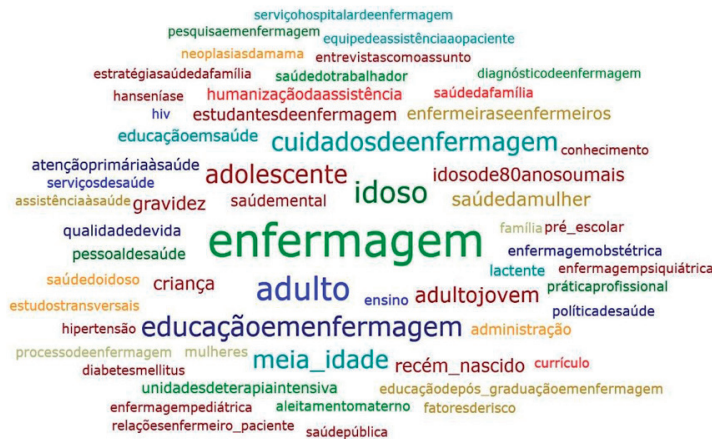
Figura 3. Nuvem de palavras elaborada a partir da frequência de ocorrência dos descritores/palavras-chave indicadas nos artigos 1981-2017. Salvador, Bahia, 2018 (N=3287).