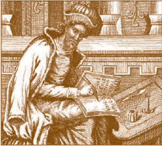
D. de Halicarnaso