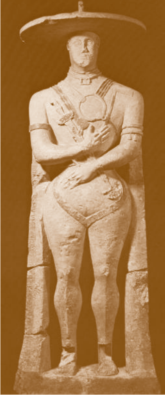
Estatua funeraria de un guerrero itálico proveniente de la necrópolis de Castrano. Siglo VI a.C. Chieti, Museo Arqueológico.