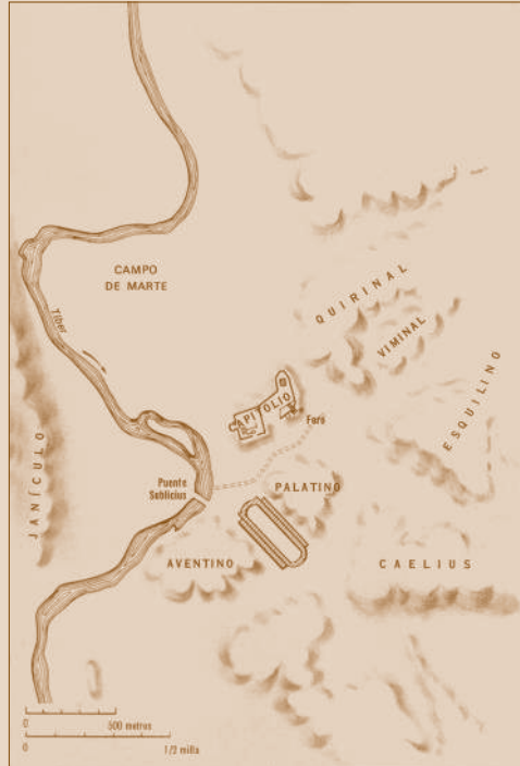
Las siete colinas de Roma.