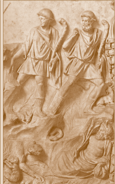
Ostia. Bajorrelieve de un altar romano que representa los orígenes míticos de Roma, fundada por Rómulo el 753 a.C. sobre la colina del Palatino. Roma. Museo Nacional Romano.

Estas medidas difundirán la imagen del rey en el Lacio y sus alrededores, las que inspirarán prácticamente todo su reinado, porque, después de las alianzas contraídas con sus vecinos, no hubo aparentemente ni guerras ni contactos diplomáticos de los que se le pueda hacer responsable. Numa es además el único rey sobre el cual las fuentes no nos entregan ninguna información sobre la recepción de alguna embajada extranjera. Sin embargo, habría que preguntarse si estos tratados lograron estabilizar las relaciones de poder en el Lacio.