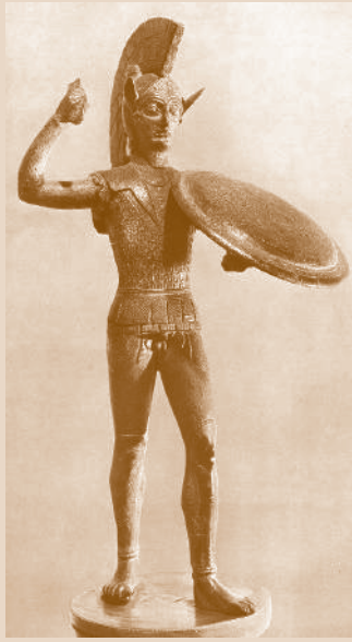
Arte Etrusco, siglo V a.C. Guerrero protector. El tema de los guerreros es común en los pequeños bronceos etrusco-italicos. Florencia, Museo Arqueológico.

Las evidencias nos permiten ver que Tarquinio el Soberbio mantuvo una activa política exterior. Tito Livio afirma que trató de ganarse sobre todo al pueblo latino, para estar más seguro entre sus conciudadanos gra-