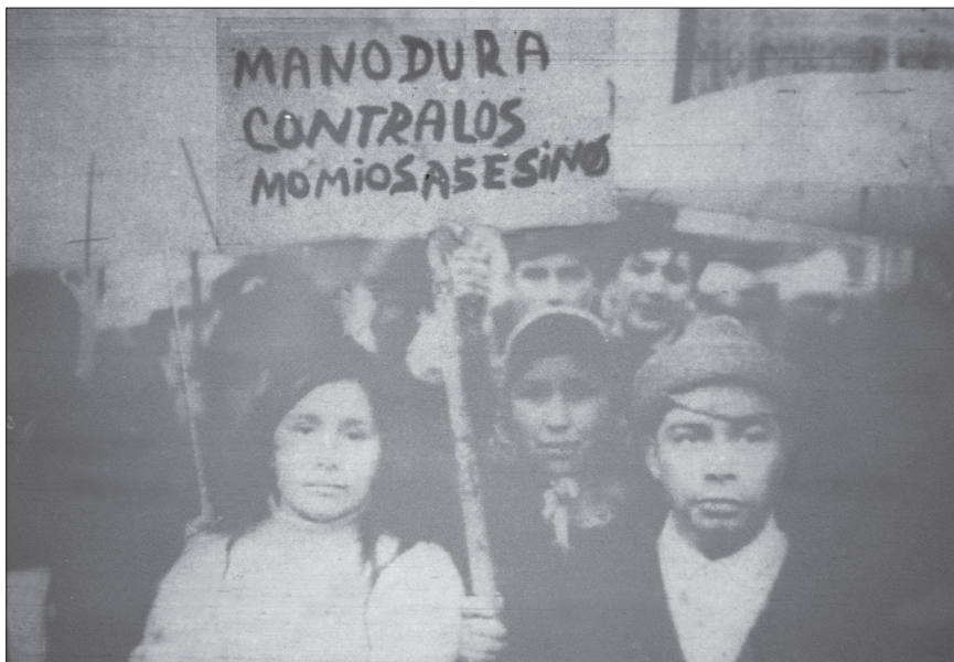
Campeñinos de Frutillar pidiendo justicia para sus compañeros del fundo “Mirador”.

gobierno por buscar justicia solo quedó en estas declaraciones. El proceso judicial sería criticado por una serie de procedimientos denunciados como irregulares.