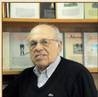
M. Rodríguez F.

E STE PRIMER VOLUMEN del año 2013 de ATENEA contiene en su parte inicial tres artículos sobre el mismo número de grandes autores latinoamericanos: Borges, Neruda y Coronel Urtecho y un cuarto trabajo de crítica literaria que parece el necesario complemento a los anteriores en cuanto toca un interesante caso de intertextualidad.