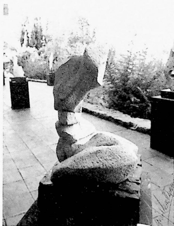
Ani Venturini: "Natura", piedra, 1984.