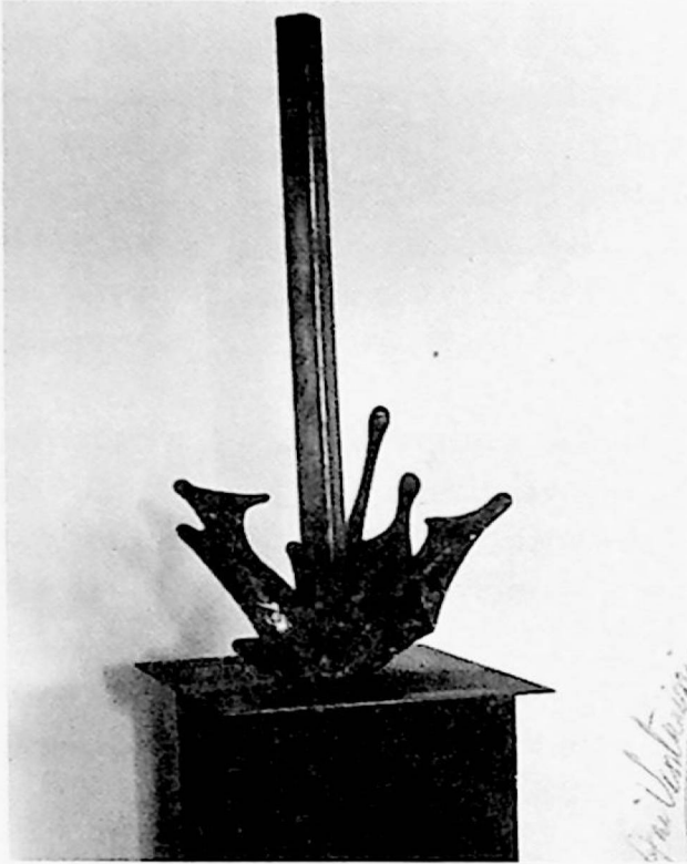
Ani Venturini: "Impacto", piedra esteatita y metal, 1986.