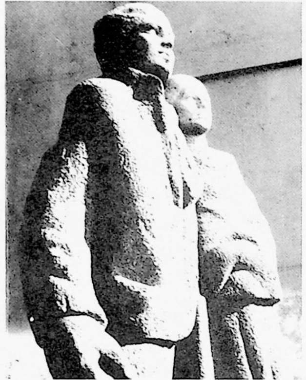
Detalle de "El inmigrante italiano".