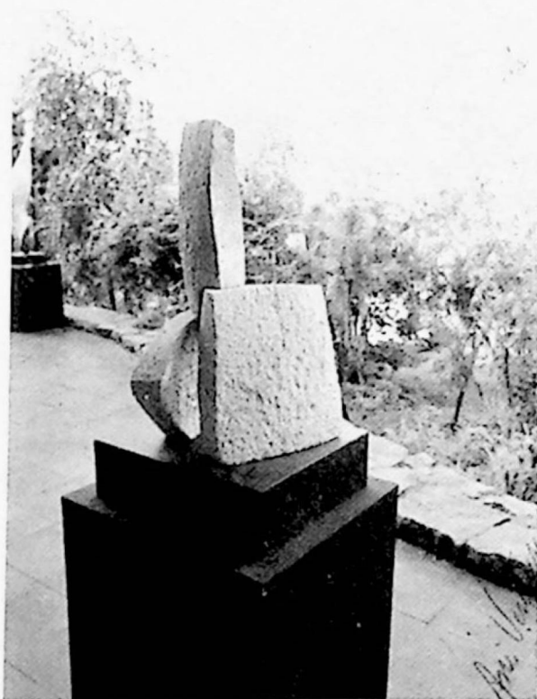
Ani Venturini: "Rocas", piedra, 1983.