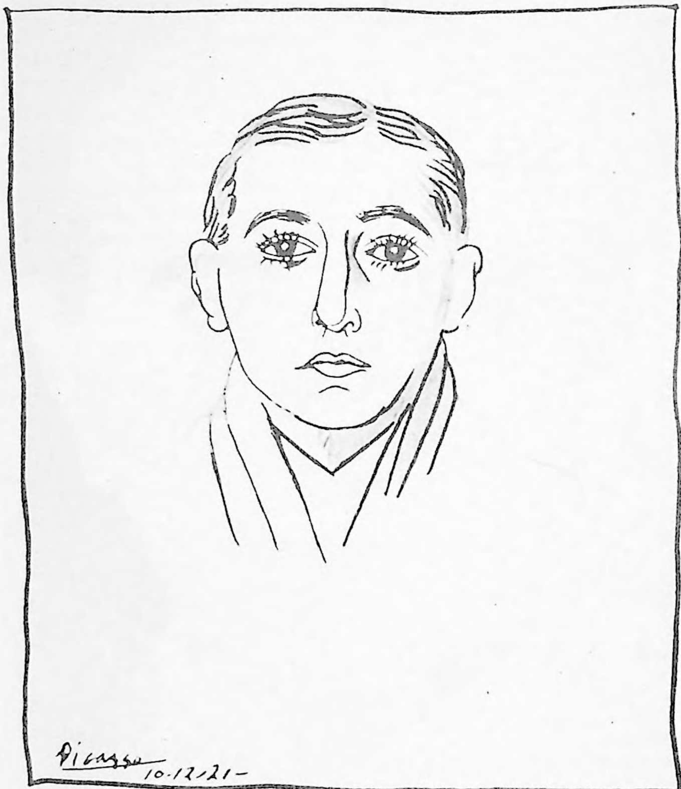
Retrato de Huidobro por Pablo Picasso.