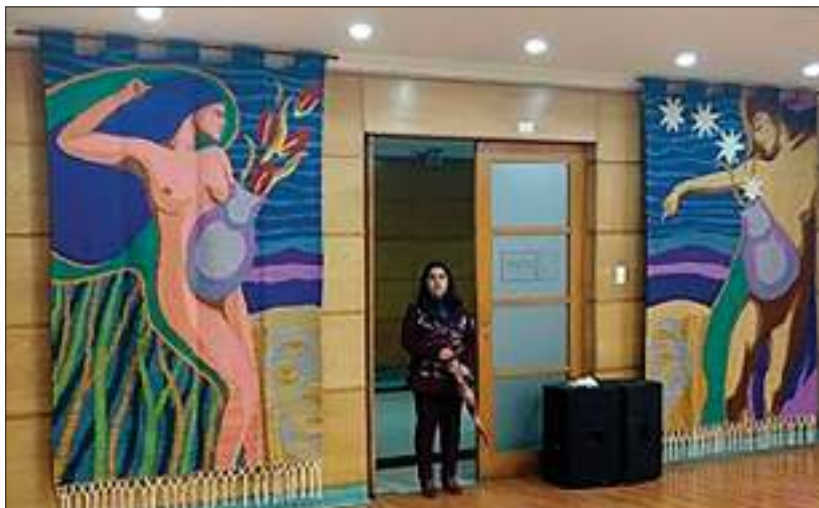
Figura 5. Obra textil “Dualidad”(2016). Viviana Rantul y Eduardo Rapiman.