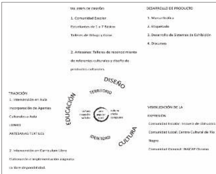
Figura 6. Modelo de intervención de diseño en contexto intercultural.

del arte textil, que cobra sentido cuando es parte de un proyecto colectivo arraigado al territorio. La escuela es un espacio de intercambio cultural, que permite la convergencia de distintos actores que tejen relaciones con el entorno cultural y territorial. La presencia del lonko y las tejedoras en el aula actúa como detonante de un proceso inicial de recuperación y diálogo intercultural visibilizado en los tejidos de niños y artesanas, que conforman una comunidad que se resiste al dominio cultural del poder hegemónico. Es así como se generan nuevos discursos textiles sobre un territorio hasta entonces despojado de un proyecto colectivo (Véase Fig. 6).