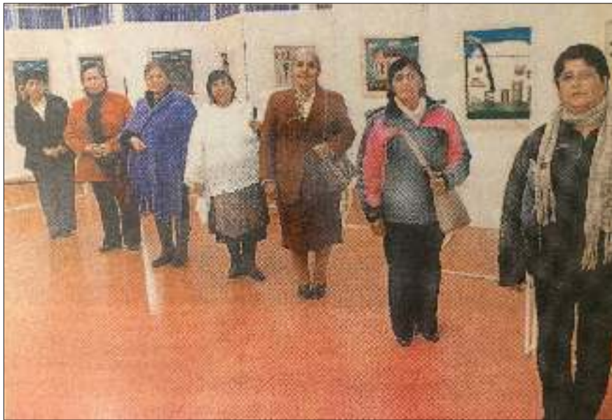
Figura 3. Artesanas textiles y sus obras en inauguración de la exposición textil “Tejiendo Sueños de Llahualco”.

La tercera etapa estuvo orientada a la visibilización de las obras en espacios culturalmente validados, de tal manera de favorecer la construcción de un puente entre arte y artesanía que permitiera el reconocimiento de las obras de estudiantes y artesanas, y la valoración del arte textil de la localidad como patrimonio inmaterial de la comunidad rural. Para ello, y con el fin de desarrollar la imagen de marca de la agrupación, se estableció un programa de diseño participativo. Así, se definió el nombre de fantasía “Tejiendo sueños de Llahualco”, para reflejar las esperanzas vinculadas al territorio y sus familias. También se diseñó equipamiento apropiado para la exposición de las obras en galerías universitarias y centros culturales, y el material de difusión contempló un discurso orientado a la visibilización de las artesanas, el territorio y la tradición textil de la localidad, que buscó recuperar la nominación de arte textil incorporando características de las obras de arte de la cultura dominante a los textiles: soportes, lugares y modos de exhibición (Ver Fig. 3).