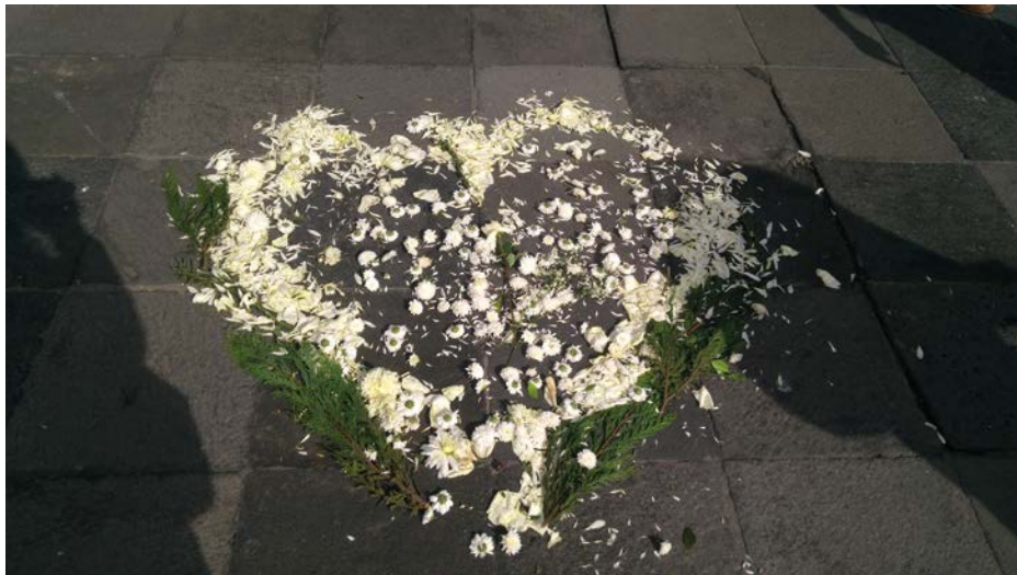
Colectivo Laboratorio Mestizo , Plaza de las Tres Culturas, Tlatelolco CDMX. Actos simbólicos colectivos, 2018. Fotografía archivo Laboratorio Mestizo .

https://doi.org/10.29393/AP13-8MICV10008