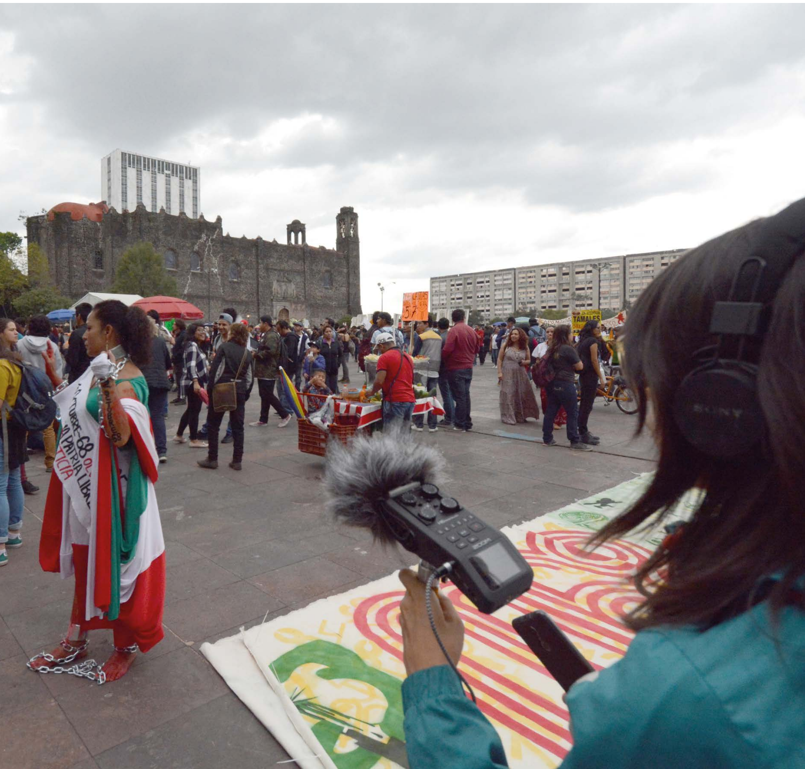
Colectivo Laboratorio Mestizo . Plaza de las Tres Culturas, 2018, Tlatelolco, CDMX. Registro sonoro, 02 de octubre.