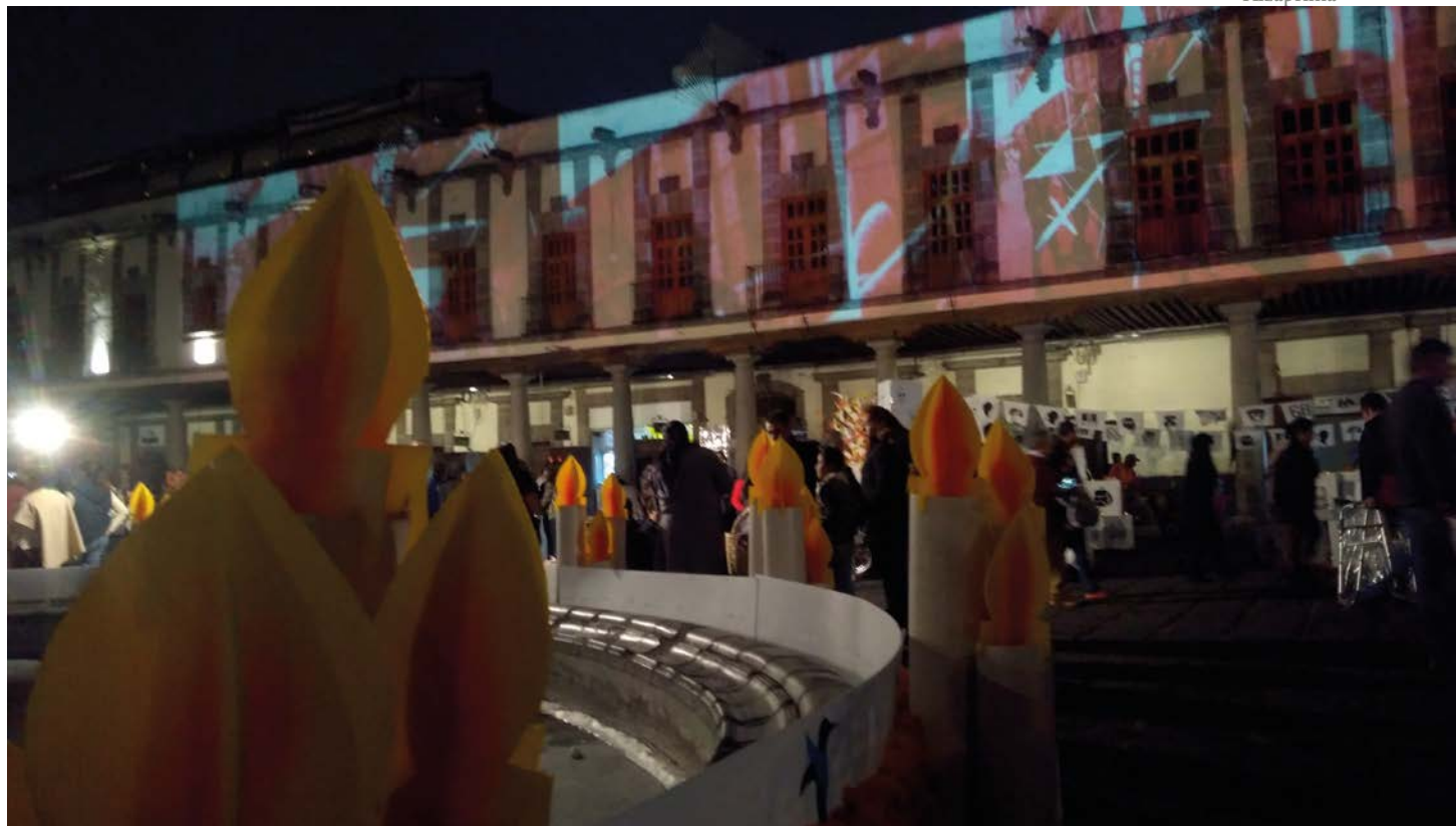
Colectivo Laboratorio Mestizo , 2018, Plaza de Santo Domingo, CDMX. Acción en vivo M68, 03 de noviembre.