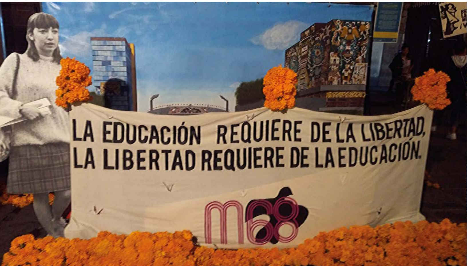
Colectivo Laboratorio Mestizo , 2018, Plaza de Santo Domingo, CDMX. Megaofrenda .