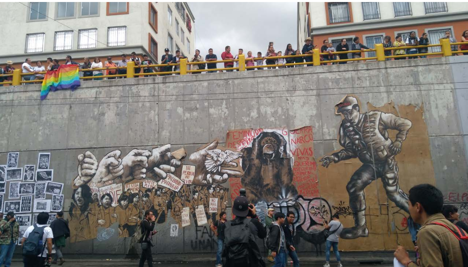
Colectivo Laboratorio Mestizo , Eje Central Lázaro Cárdenas, 2018, CDMX. Registro marcha, 02 de octubre.