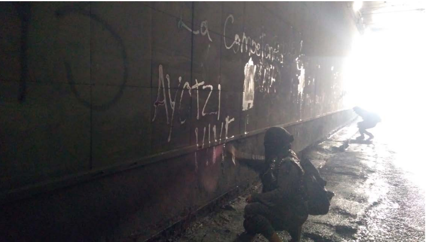
Colectivo Laboratorio Mestizo , 2018, Eje central Lázaro Cárdenas, CDMX. Registro marcha, 02 de octubre.