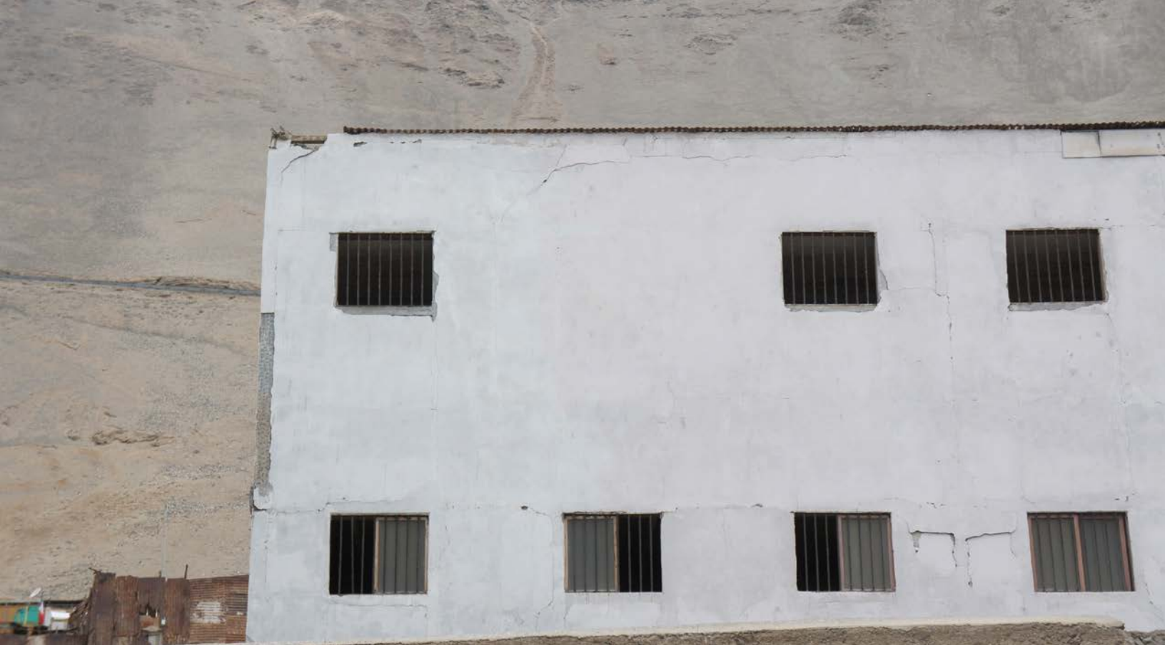
Colectiva Perimetral , Cárcel de Pisagua, 2016, Tarapacá, Chile. Proceso investigación.