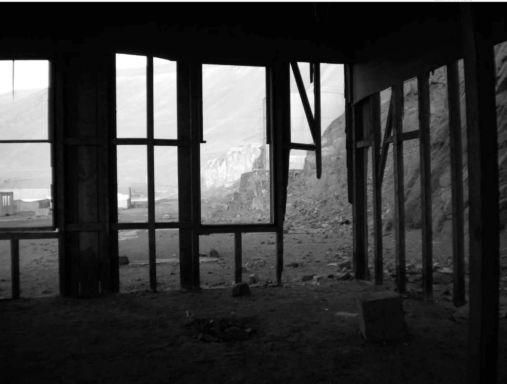
Colectiva Perimetral, Vista de la Caleta de Pisagua, 2016, Tarapacá, Chile. Proceso investigación.