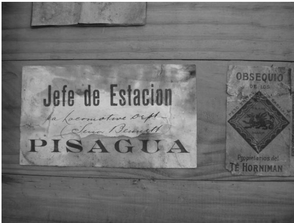
Colectiva Perimetral , Ex Estación de Trenes de Pisagua, 2015, Tarapacá, Chile. Proceso investigación.

https://doi.org/10.29393/AP13-7SPVC10007