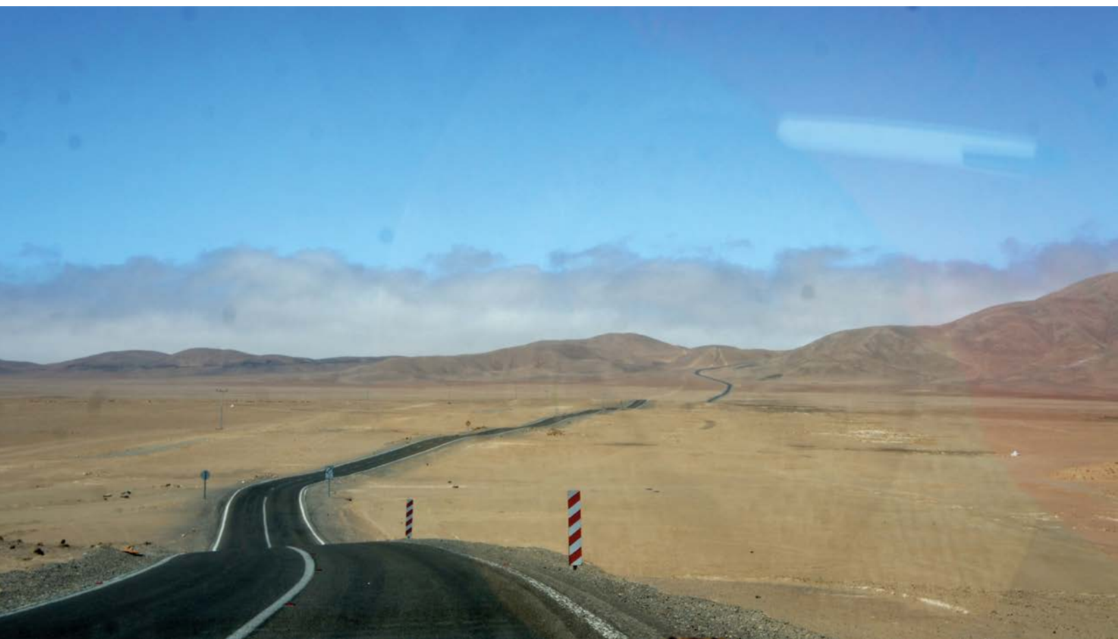
Colectiva Perimetral , Camino a Pisagua, Pampa Negra, 2016, Tarapacá, Chile. Proceso investigación. Fotografía: Vania Caro Melo.