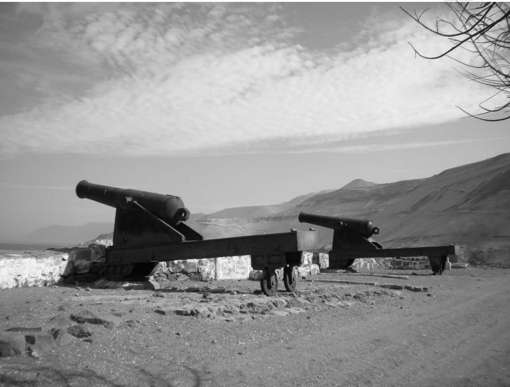
Colectiva Perimetral , Cañones en Bahía de Pisagua, 2016, Tarapacá, Chile. Proceso investigación.