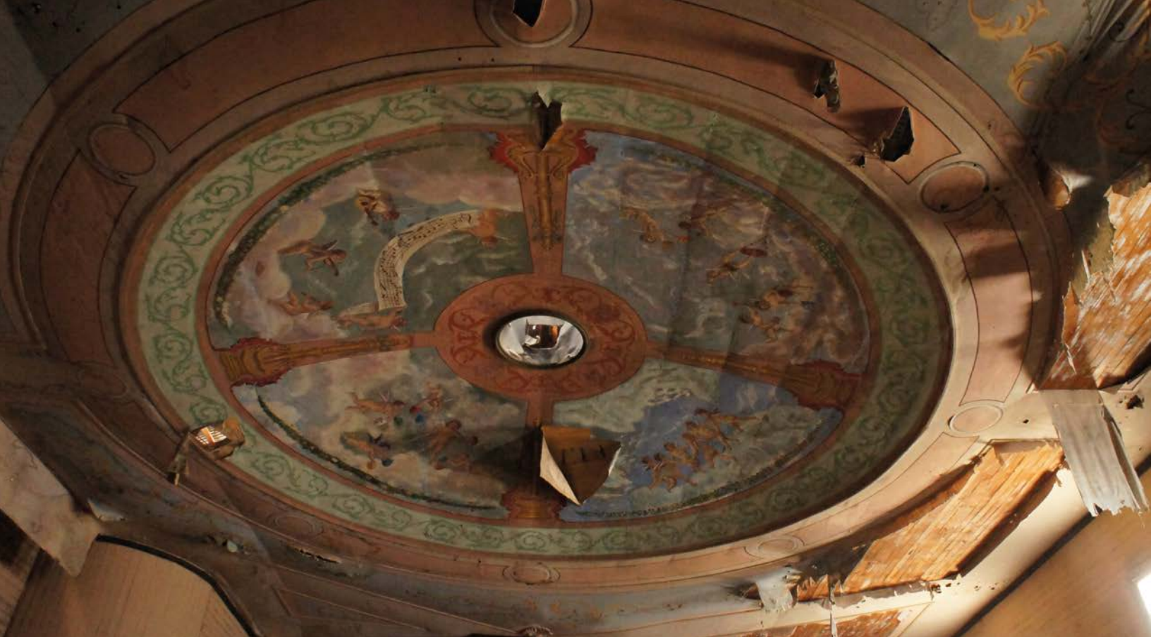
Colectiva Perimetral , Mural de pintor Sixto Rojas, techo del teatro de Pisagua, 2014, Tarapacá, Chile. Proceso investigación.