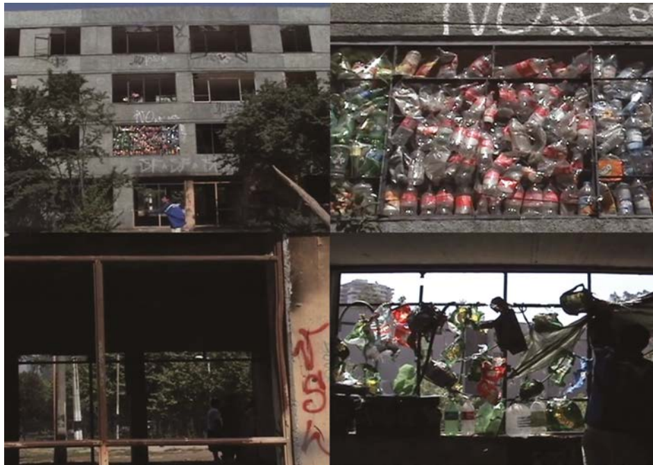
Fig. n°1: Acción urbana en Villa San Luis , 2009, Santiago, Chile. Fotomontaje a partir de frame de video, formato 4:3, 6.07 min. Cámara: Mathias Klenner. Edición: Valentina Utz.

https://doi.org/10.29393/AP13-6NCVU10006