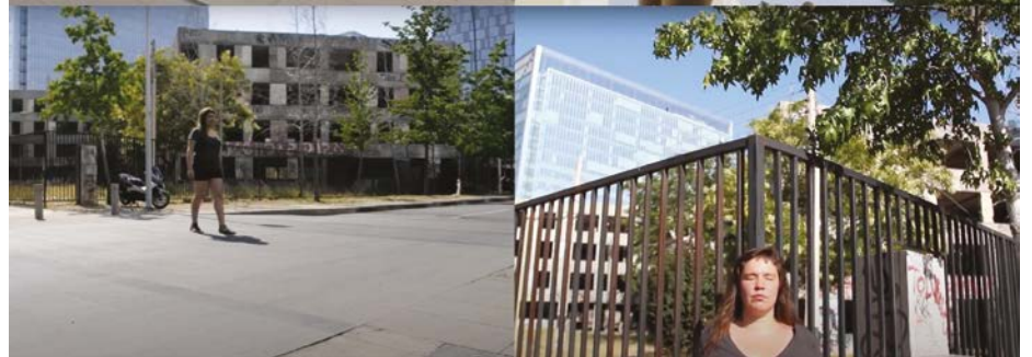
Fig. nº6, 7, 8