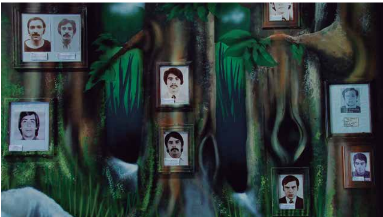
Fotograma video. El Complejo .