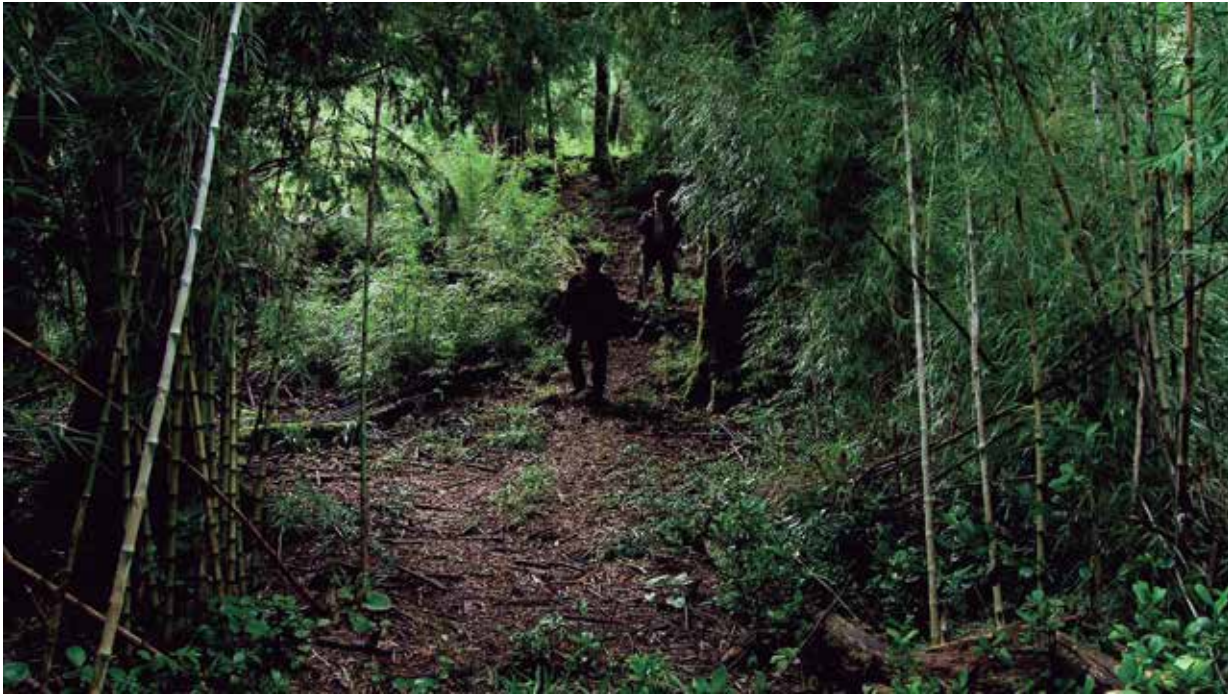
Fotograma video. El Complejo .