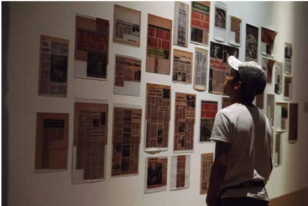
El Complejo, 2014. En Acciones Territoriales, Ex Teresa Arte Actual, México D.F.