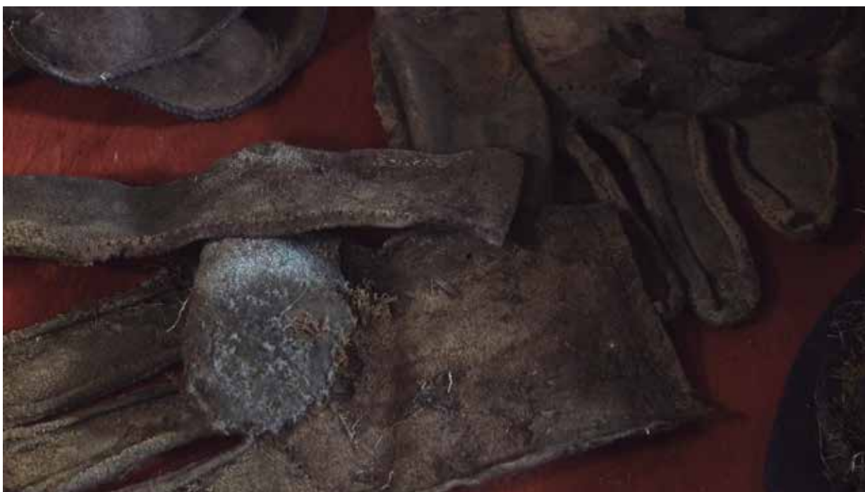
Fotograma video. El Complejo .