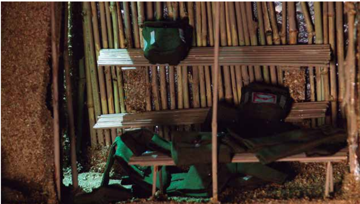
Fotograma video. El Complejo .