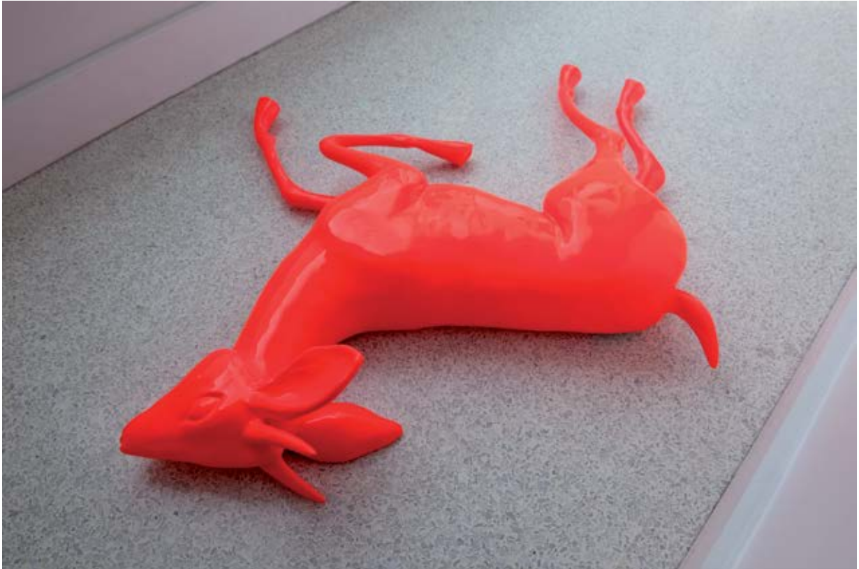
Fig. nº1: Venado. Hierro, esmalte. 22" x 5" x 20". Galeria Burnet, Minneapolis. 2011.