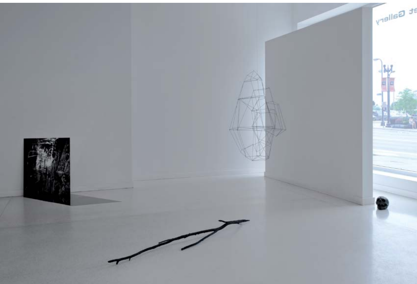
Fig. nº2: Nube Cueva. Instalación dimensiones variables. Bronce, impresión inkjet. Galeria Burnet, Minneapolis. 2011.