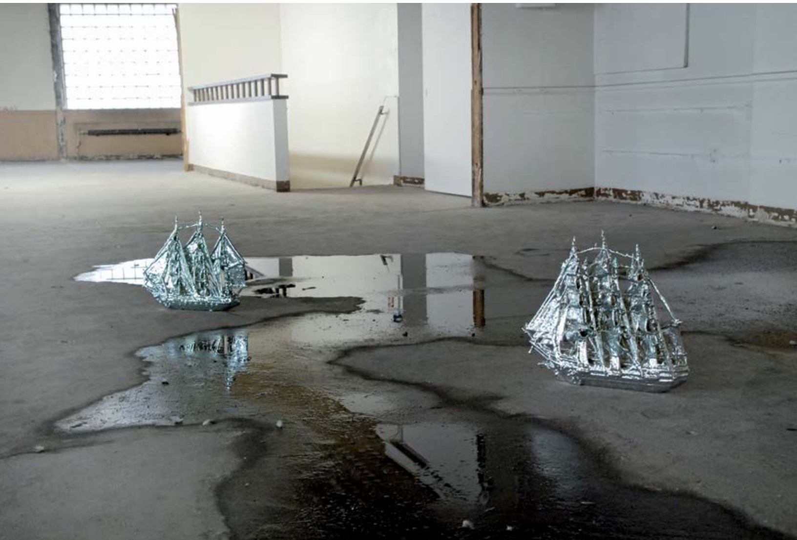
Fig. nº3: Barco. Barco modelo, latex, pintura cromada. 17" x 4.5" x 18" (cada uno). Shinders, Minneapolis. 2009.