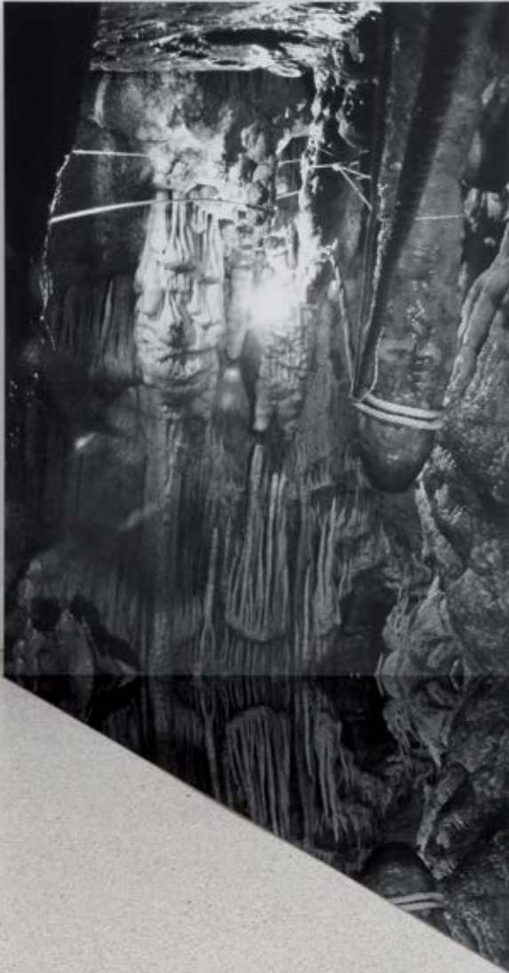
Fig. nº5: Cueva. Impression inkjet, Dibond, acero inoxidable pulido. 30" x 50" x 40". Galeria Burnet, Minneapolis. 2011.