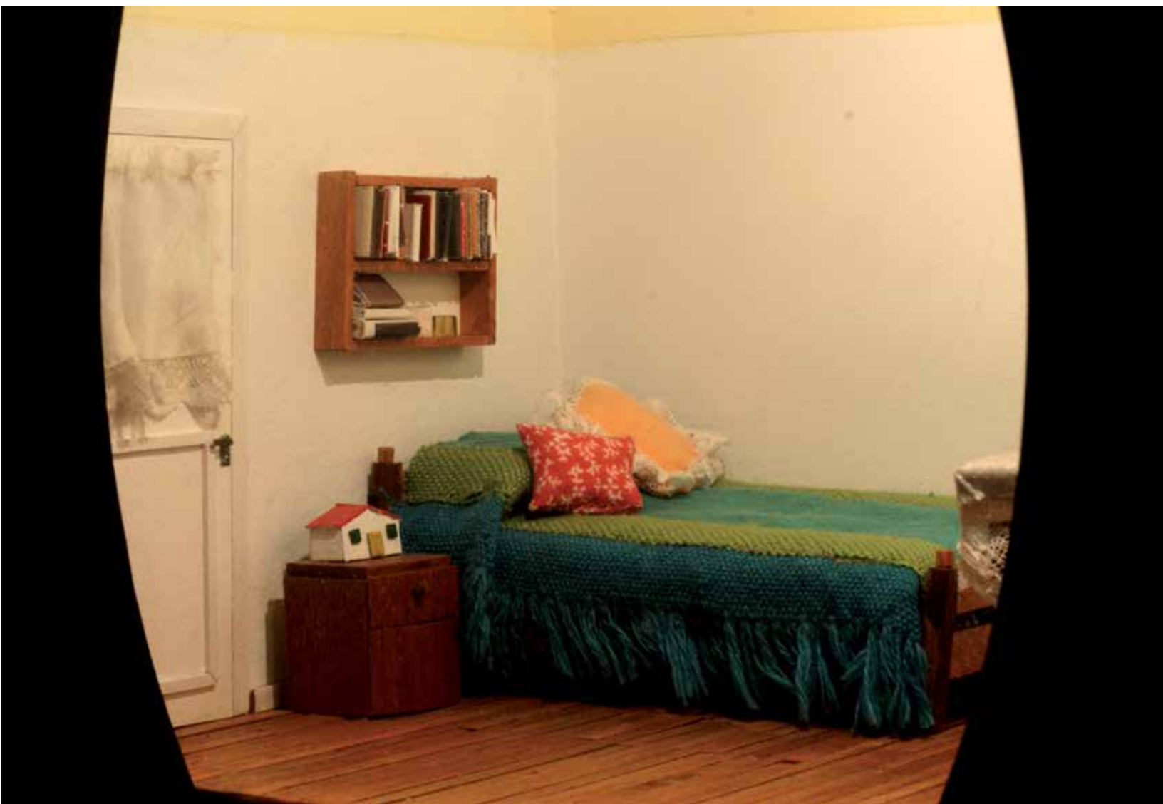
Proyecto "Relatos de Habitación". "De vuelta en los Castaños". Pasaje Montecarlo 16, Los Castaños. Chiguayante. Técnica Mixta. 1991.