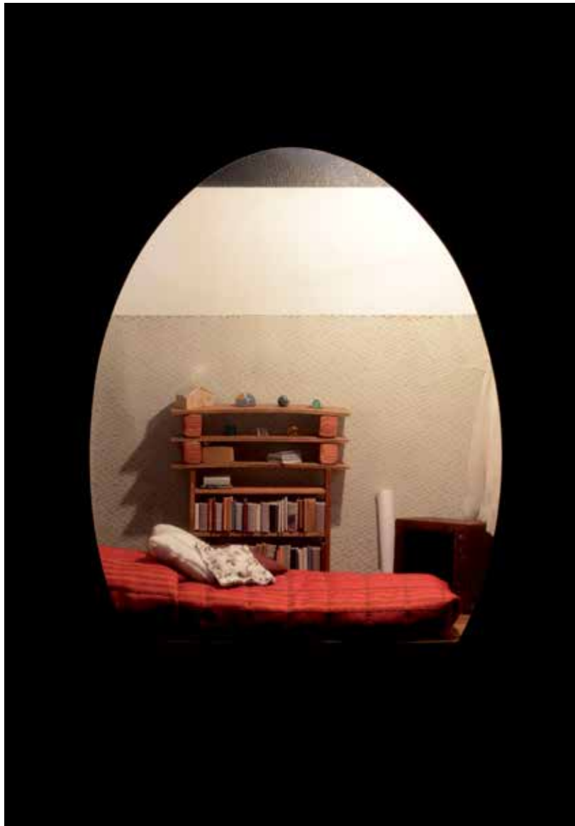
Proyecto "Relatos de Habitación". Relato de habitación 29. "Edificio Tucapel". Tucapel con O'higgins, quinto piso, Concepción. Técnica Mixta (18.5 x 26 x 31 cms.) 2003.