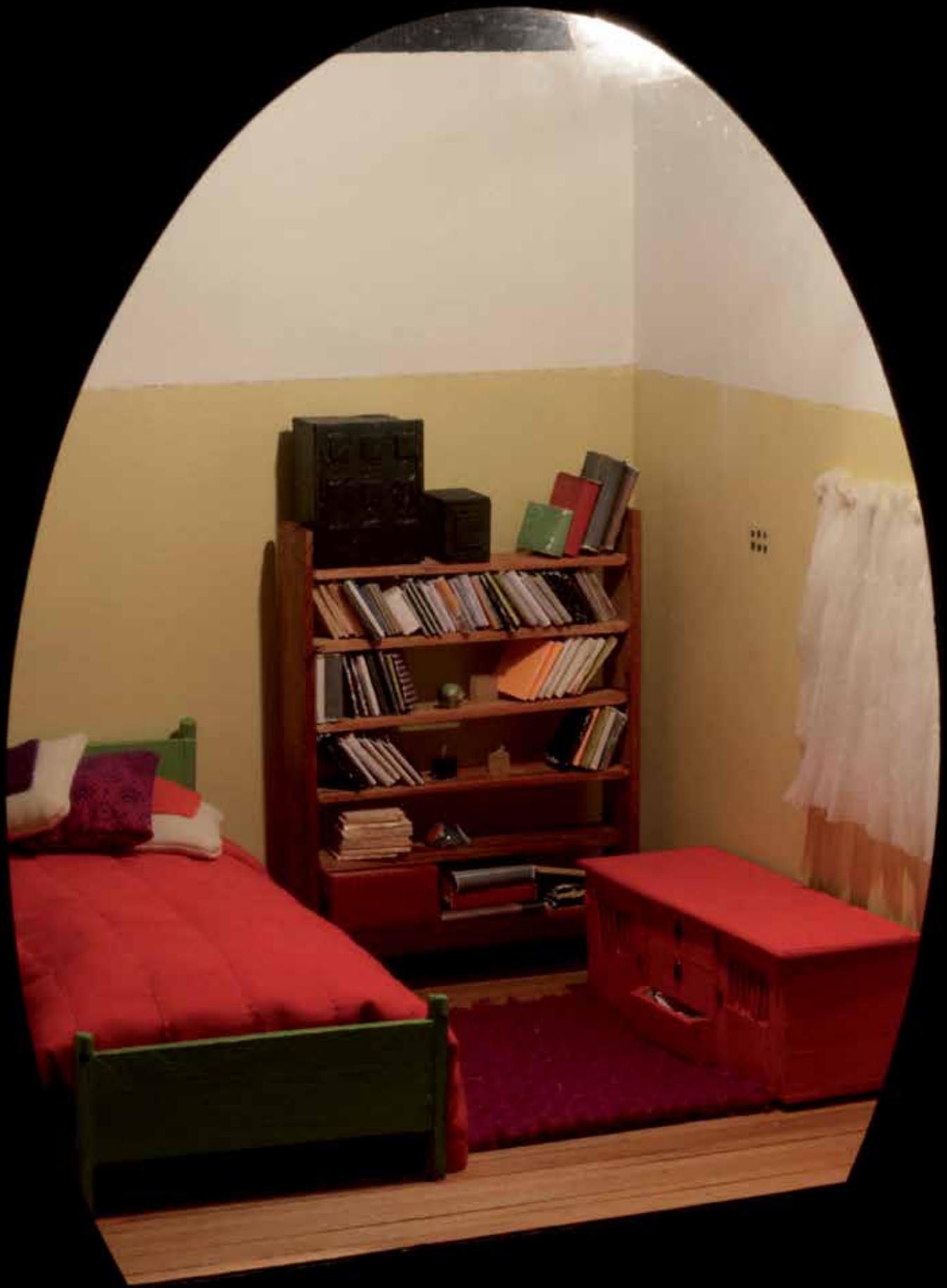
Proyecto "Relatos de Habitación". "La pieza de luz". Av. 21 de Mayo, 2654 departamento 9, Concepción. Técnica Mixta. 2008.