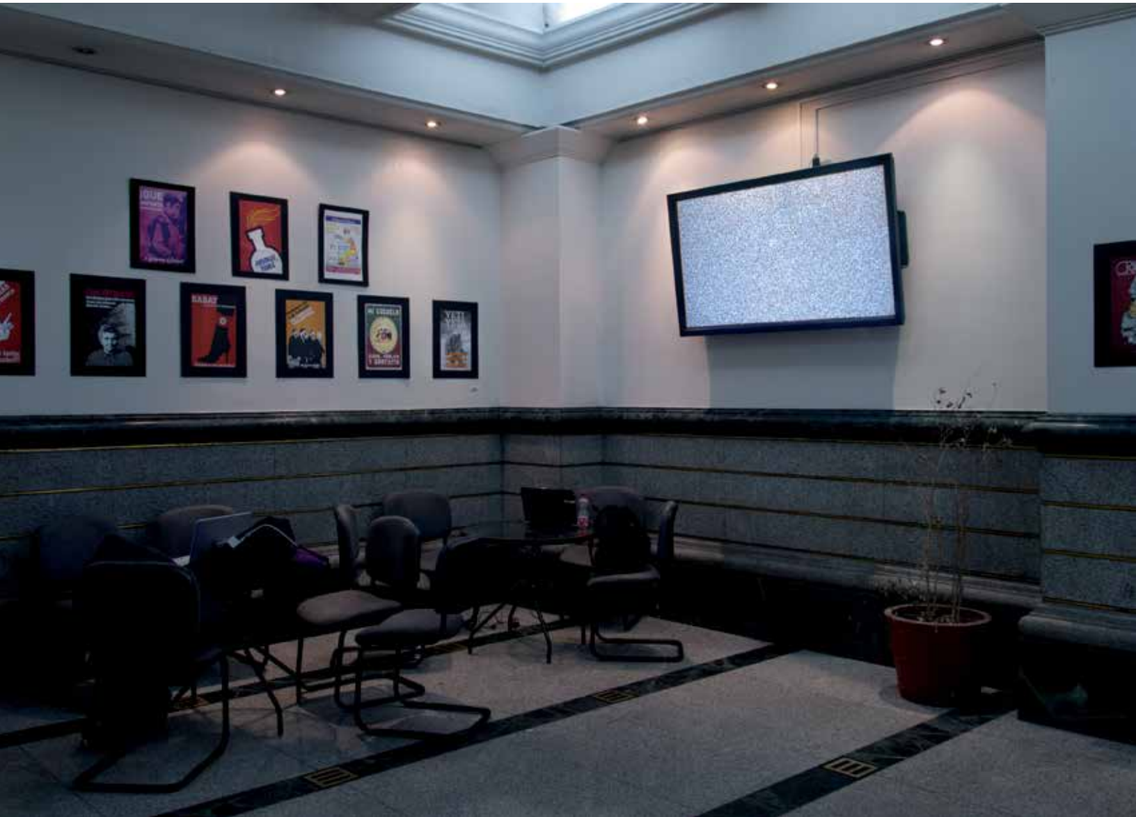
S/T, Serie "Ruido Blanco". Nicolás Sáez, 2012.