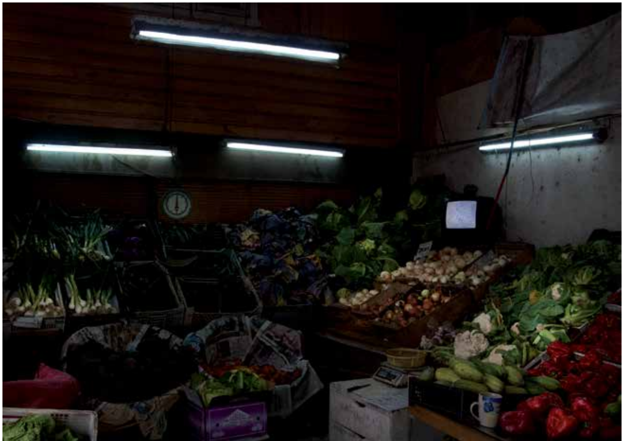
S/T, Serie "Ruido Blanco". Nicolás Sáez, 2012.