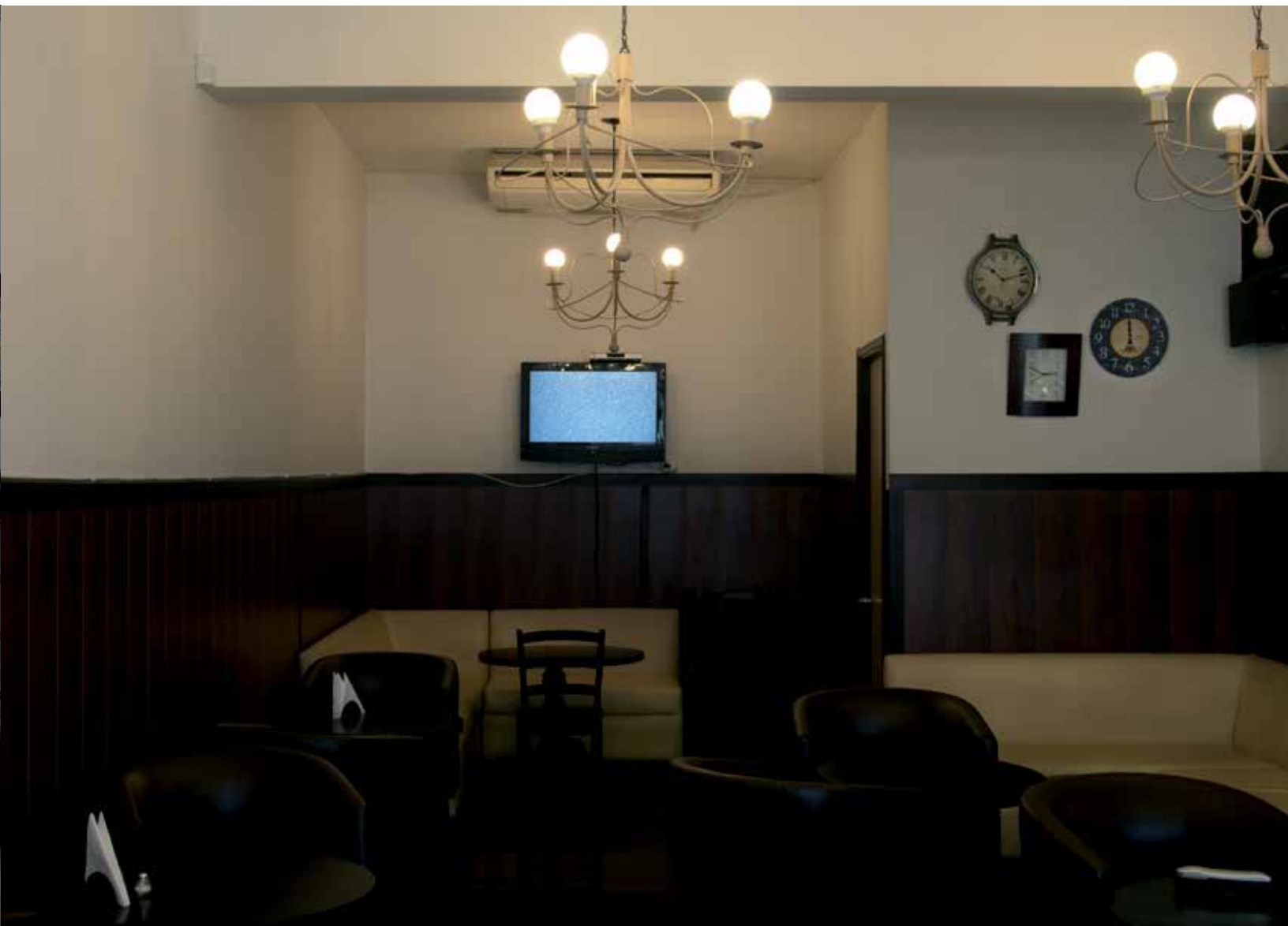
S/T, Serie "Ruido Blanco". Nicolás Sáez, 2012.