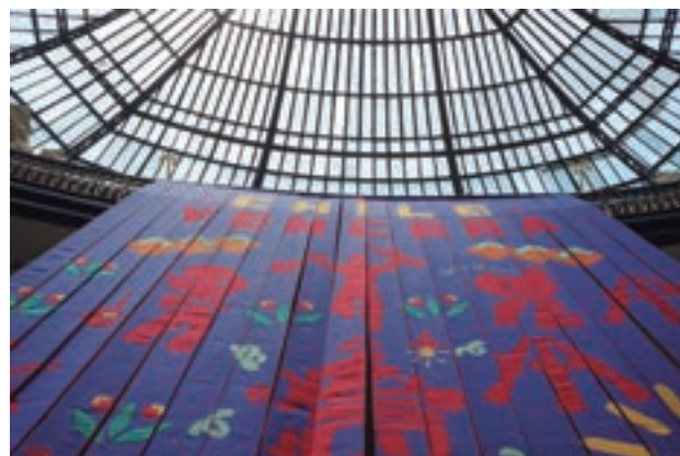
Estandarte Chile Vencerá de John Dugger, Museo Nacional de Bellas Artes, Santiago de Chile. Colección Privada, enero, 2014.