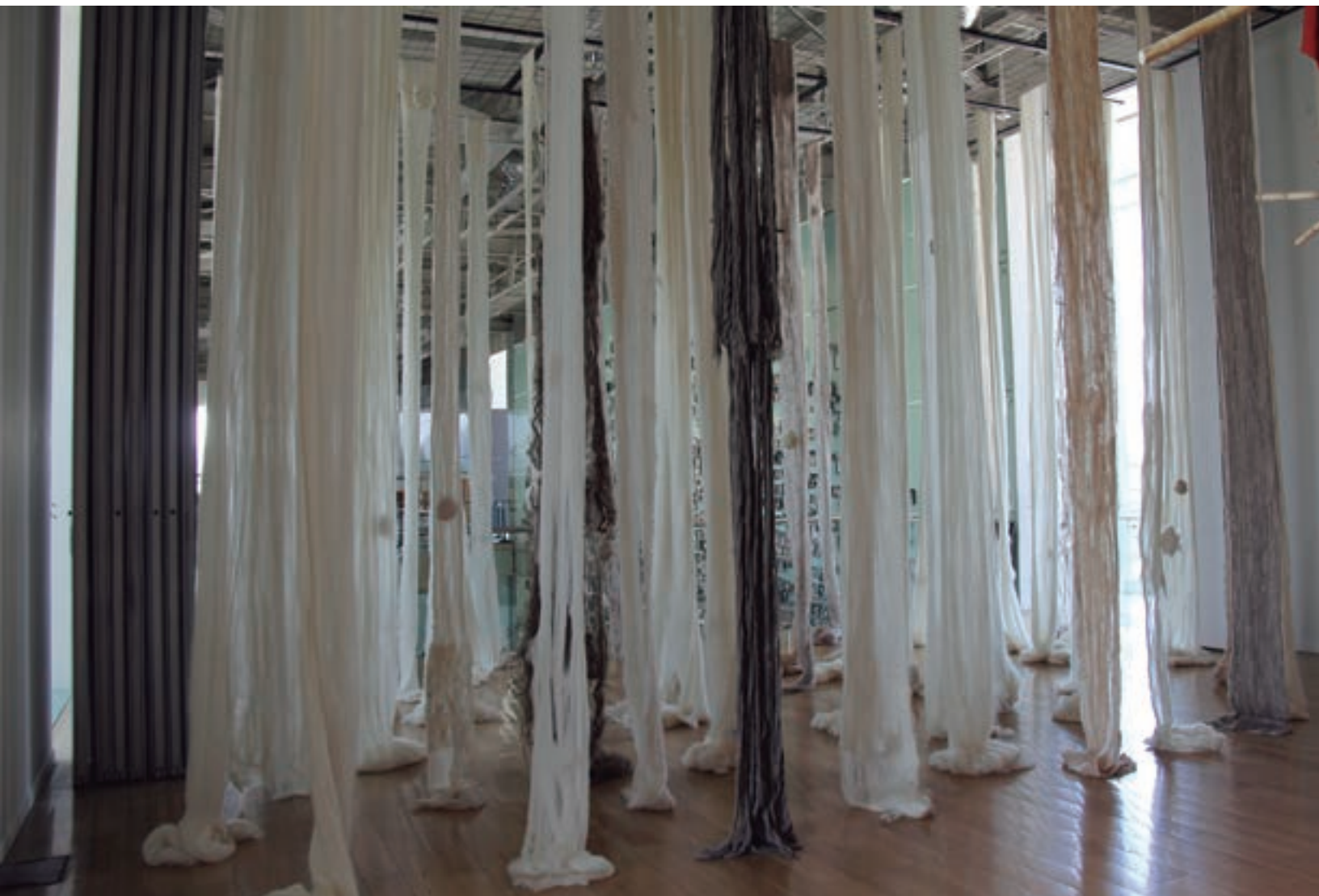
El Quipu de lamentos . Instalación de Cecilia Vicuña honrando a los artistas. Museo de la Memoria y Derechos Humanos, Santiago de Chile, enero de 2014.