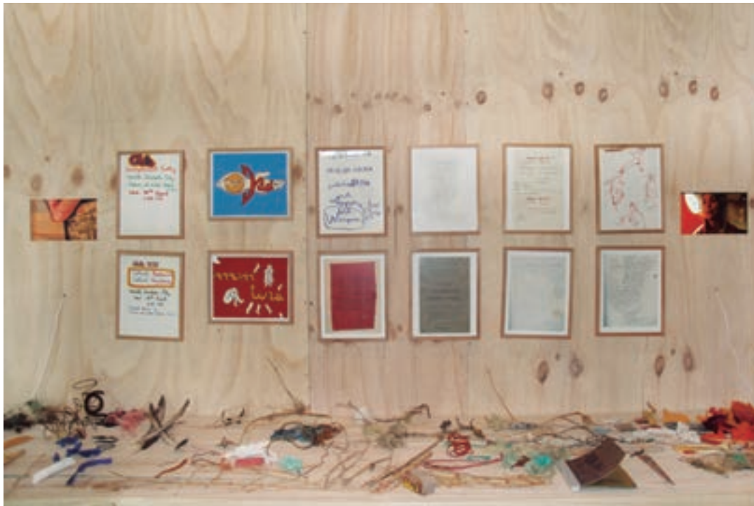
Taller de basuritas y Palabramas y dibujos de 1974. Instalación de Cecilia Vicuña. Incluye dos videos de Carolina Zuñiga. Museo de la Memoria y los Derechos Humanos. Santiago de Chile, enero de 2014.