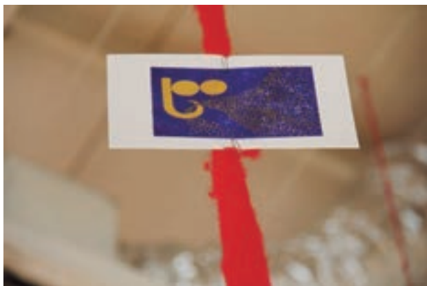
Obra de Méret Oppenheim, donada a AFD, hoy en la colección de Museo de la Solidaridad Salvador Allende, Santiago de Chile.

El festival en el Royal College of Art realizó un remate de las 326 obras donadas para apoyar la resistencia. Pero, no tuvo el éxito esperado. Los artistas de AFD se disgregaron por desacuerdos políticos y la historia de nuestra movilización fue olvidada.