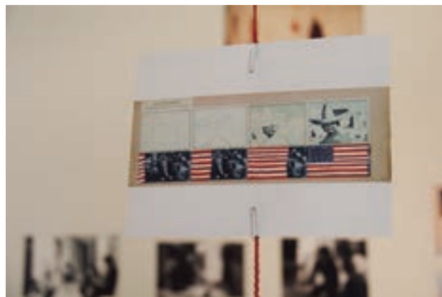
Obra de Derek Boshier, donada a AFD, hoy en la colección de Museo de la Solidaridad Salvador Allende, Santiago de Chile.

Durante la investigación para organizar "Artists for Democracy: el archivo de Cecilia Vicuña", un conjunto de más de 100 obras que habían sido donadas a AFD en 1974, aparecieron en el depósito del Museo de la Solidaridad Salvador Allende (MSSA). Estas obras habían llegado sin una filiación clara. Hoy se sabe que este legado llegó a Chile a raíz del trabajo de Artists for Democracy.