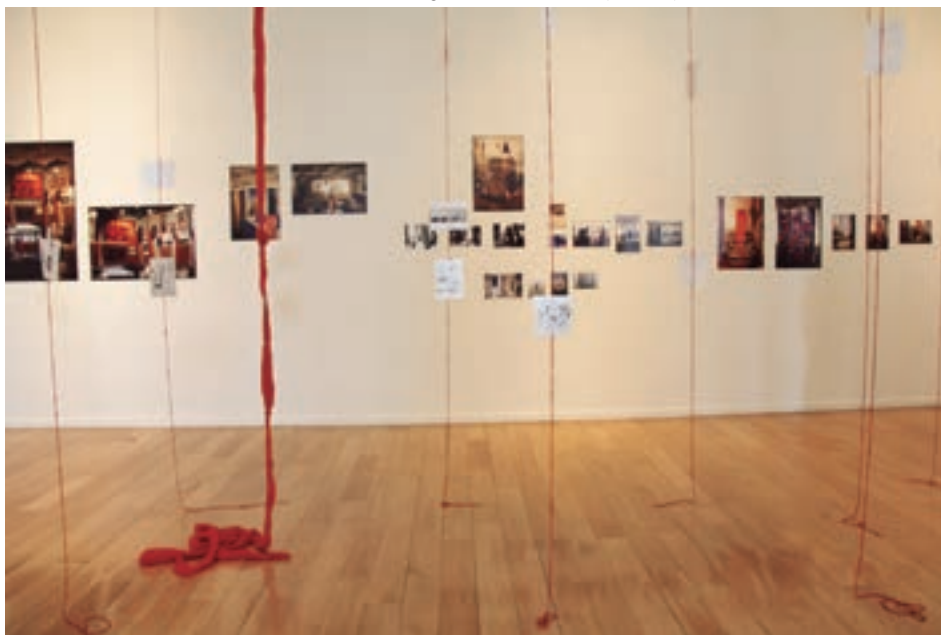
El Quipu Rojo. Instalación de Cecilia Vicuña honrando a los artistas. Museo de La Memoria y Derechos Humanos, Santiago de Chile, enero de 2014.

El Festival de las Artes por la Democracia en Chile, 1974, reunía todas las artes y presentó múltiples simposios y performances. Incluía obras de artistas como Roberto Matta, Julio Cortázar, Christo, Claes Oldenburg y David Hockney, junto a jóvenes y colectivos de todo el mundo.