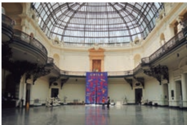
Estandarte Chile Vencerá de John Dugger, Museo Nacional de Bellas Artes, Santiago de Chile. Colección Privada, enero, 2014.

Durante la investigación para organizar "Artists for Democracy: el archivo de Cecilia Vicuña", un conjunto de más de 100 obras que habían sido donadas a AFD en 1974, aparecieron en el depósito del Museo de la Solidaridad Salvador Allende (MSSA). Estas obras habían llegado sin una filiación clara. Hoy se sabe que este legado llegó a Chile a raíz del trabajo de Artists for Democracy.