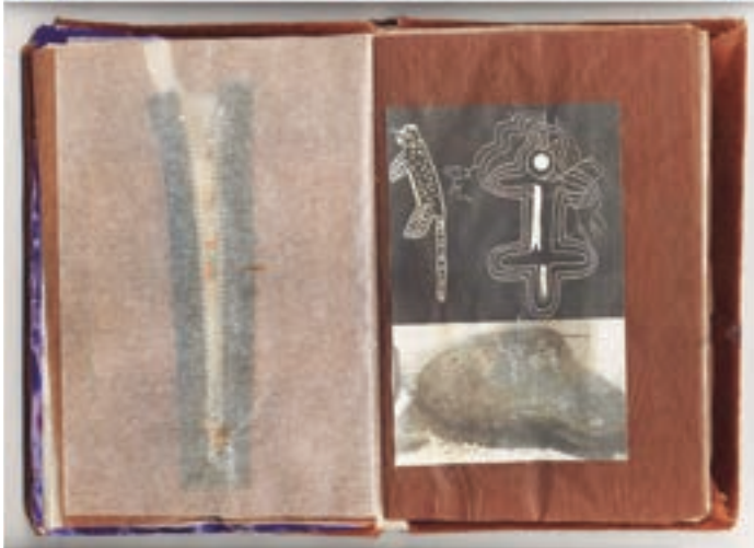
El día del golpe estaba en Londres. Esa noche pinté el cuadro La Muerte de Allende.

Llegué a Londres el 26 de septiembre de 1972, a estudiar arte en la Slade School of Fine Arts. Comencé un archivo de basuritas londineses, sintiendo que en cualquier momento habría un golpe militar.