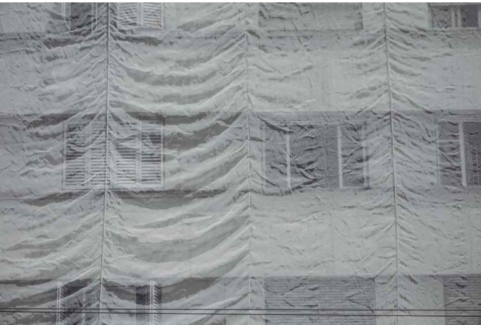
Sin título , 2014. Fotografía digital.