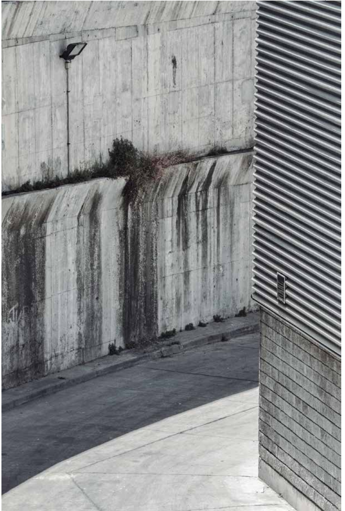
Sin título , 2014. Fotografía digital.