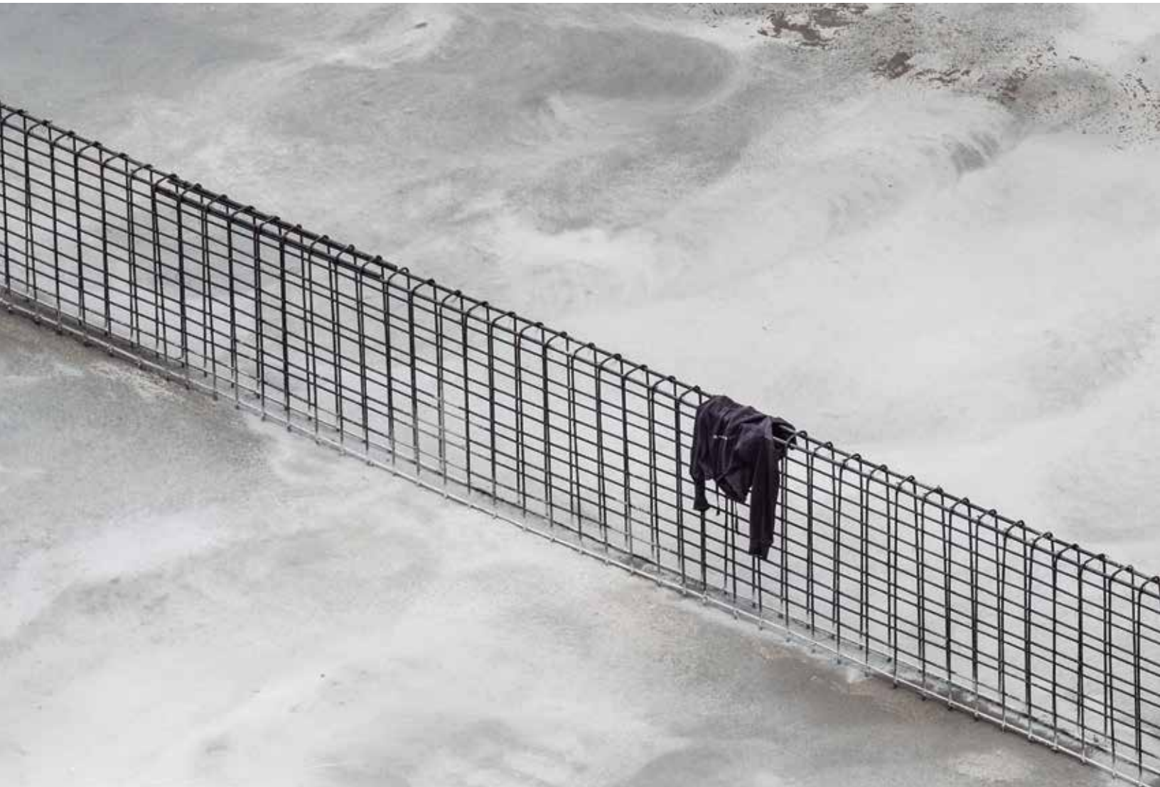
Sin título , 2014. Fotografía digital.