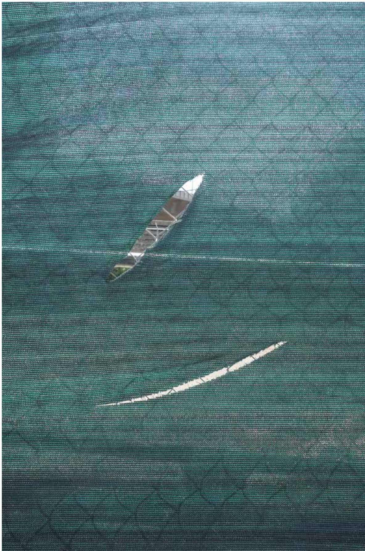
Sin título , 2015. Fotografía digital.