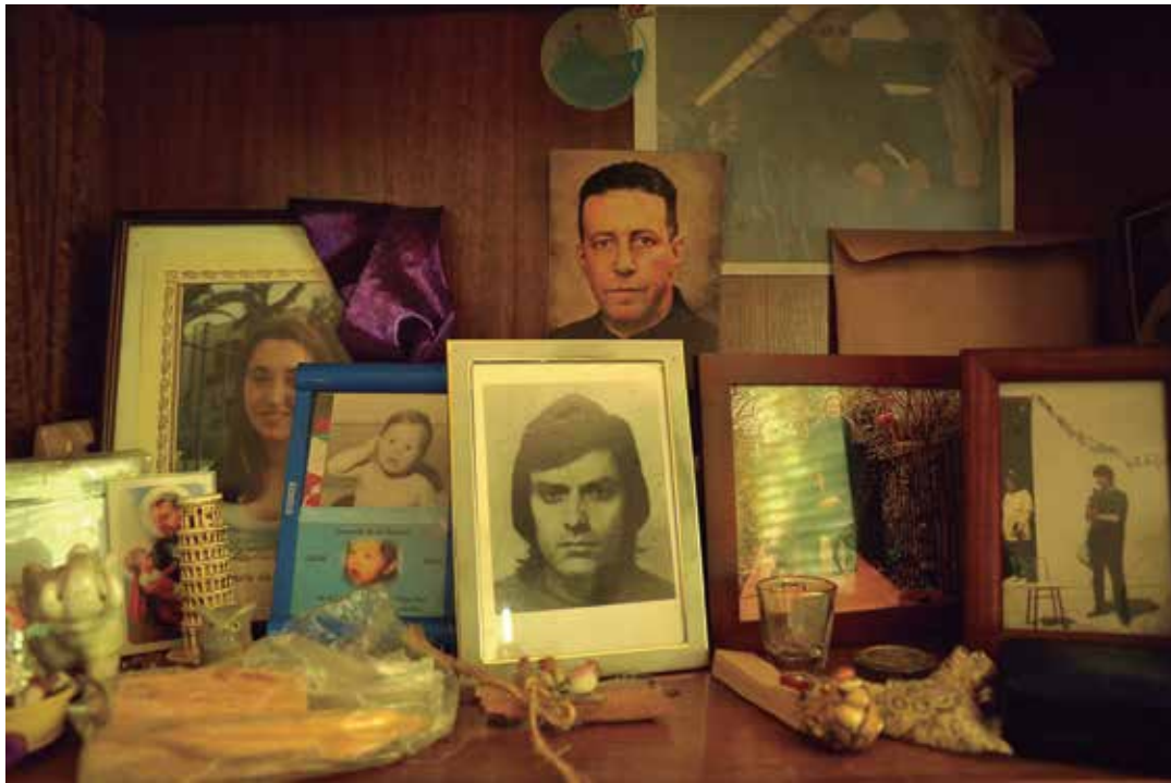
Hilos de Ausencia: Genealogías y Discontinuidades. Encuentros de bordado, 2014, Santiago, Chile.