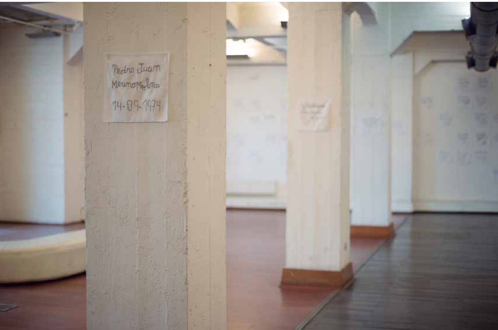
Hilos de Ausencia: Genealogías y Discontinuidades . Instalación Biblioteca de Santiago, 2015, Santiago, Chile. Fotografía: Viviana Silva en colaboración con Sebastián Venegas.