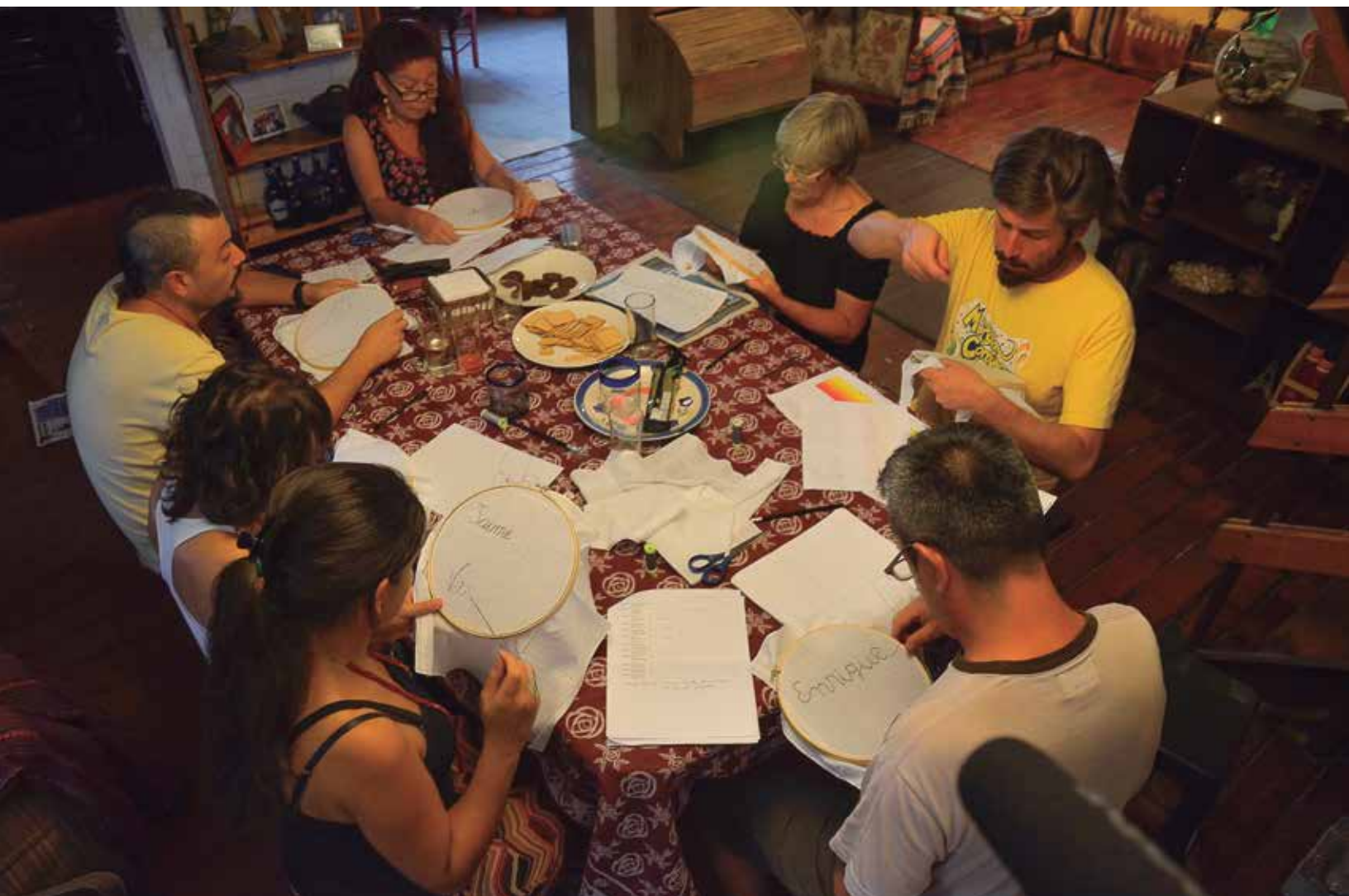
Hilos de Ausencia: Genealogías y Discontinuidades. Encuentros de bordado, 2014, Santiago, Chile.