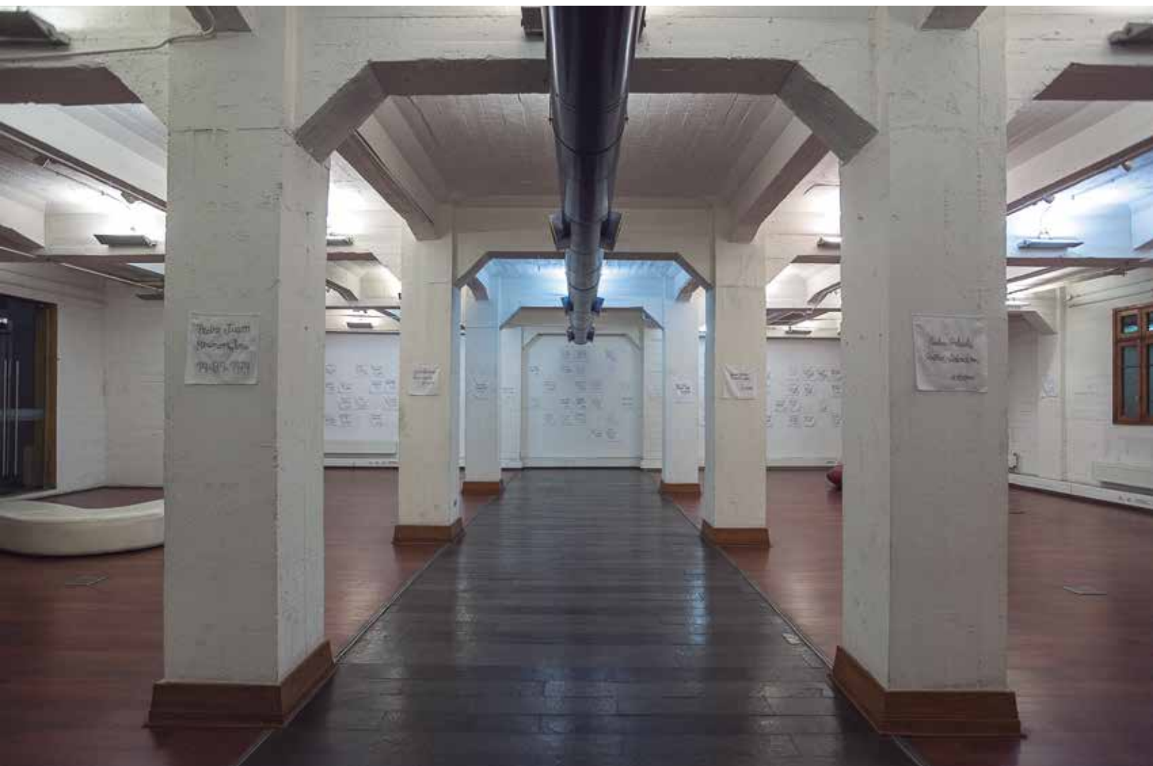
Hilos de Ausencia: Genealogías y Discontinuidades . Instalación Biblioteca de Santiago, 2015, Santiago, Chile.