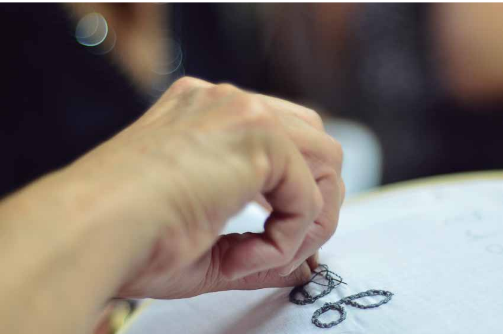
Hilos de Ausencia: Genealogías y Discontinuidades. Encuentros de bordado, 2014, Santiago, Chile.