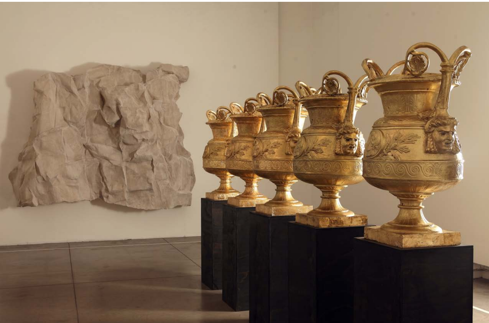
Luis Montes. El rapto de Europa , 2016. Instalación de 5 jarrones y fotografías. Exposición Santa Lucía . Museo de Arte Contemporáneo, Santiago, Chile.