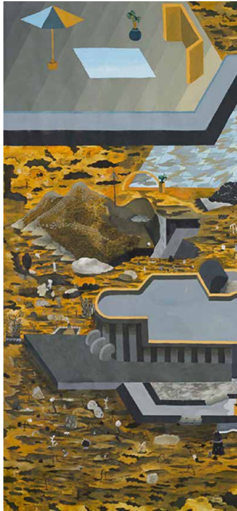
Estrategias para no morir , Súbita, La Plata, Argentina, 2020. Fotografía: Colección del autor.