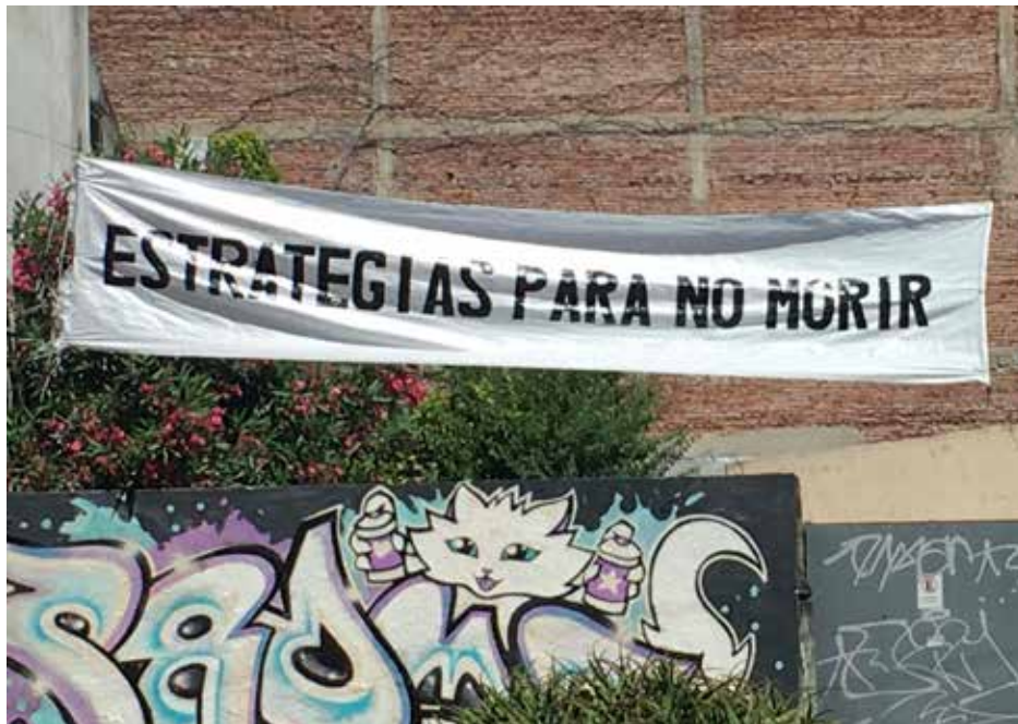
Estrategias para no morir, Súbita, La Plata, Argentina, 2020.

https://doi.org/10.29393/AP14-7EPJE30007