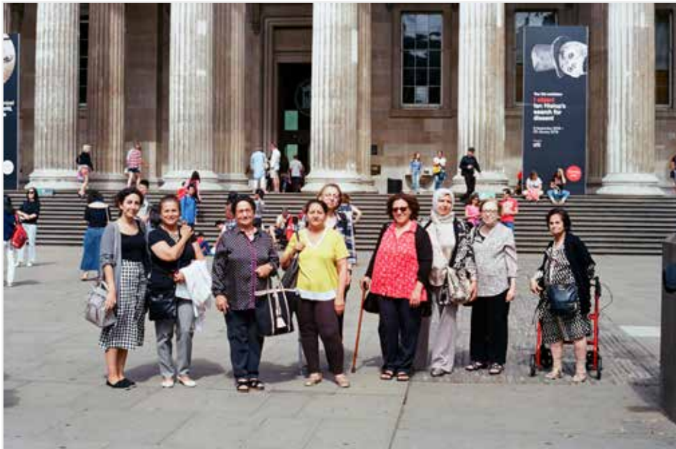
Objets removed for study , Mujeres participantes en el Museo Británico de Londres para ver la Biblioteca original de Ashurbanipa, 2018. Iraqi Association of London, Inglaterra.

https://doi.org/10.29393/AP14-8ORRG10008