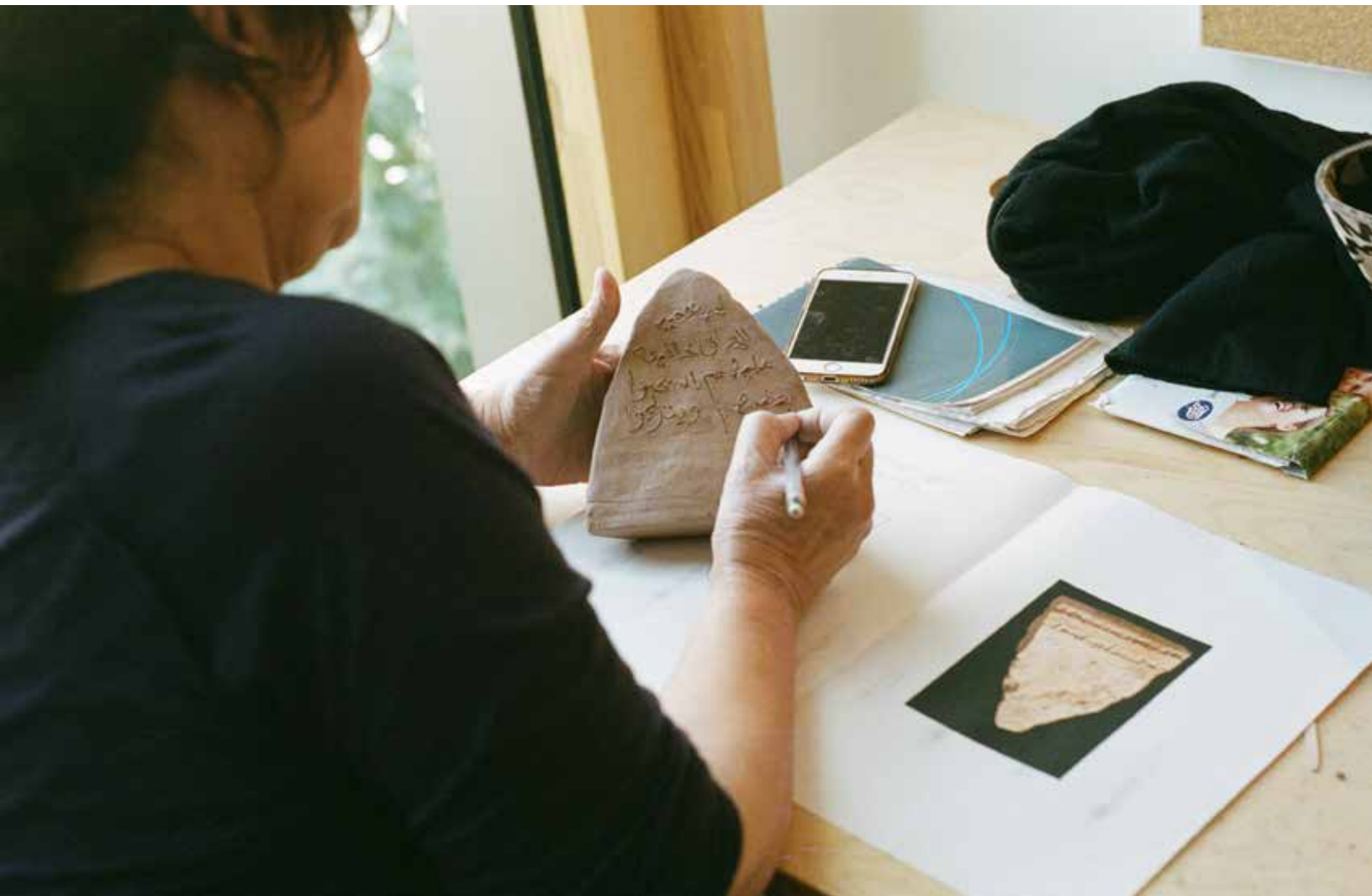
Objets removed for study , Proceso de construcción de cerámicas en la University College London, 2018. Iraqi Association of London, Inglaterra.