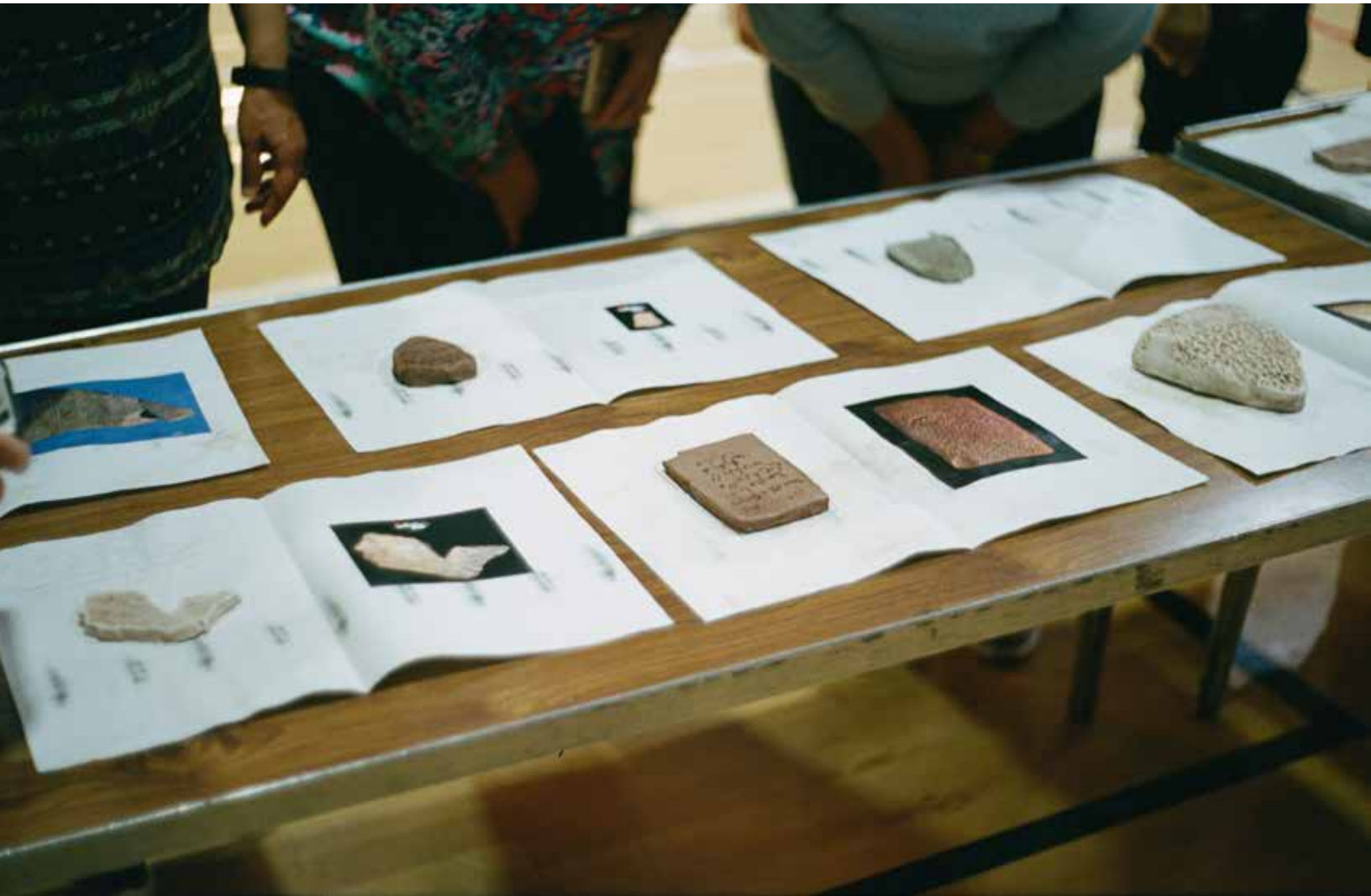
Objets removed for study , Proceso de construcción de cerámicas en la University College London, 2018. Iraqi Association of London, Inglaterra. Fotografía: Rafael Guendelman.