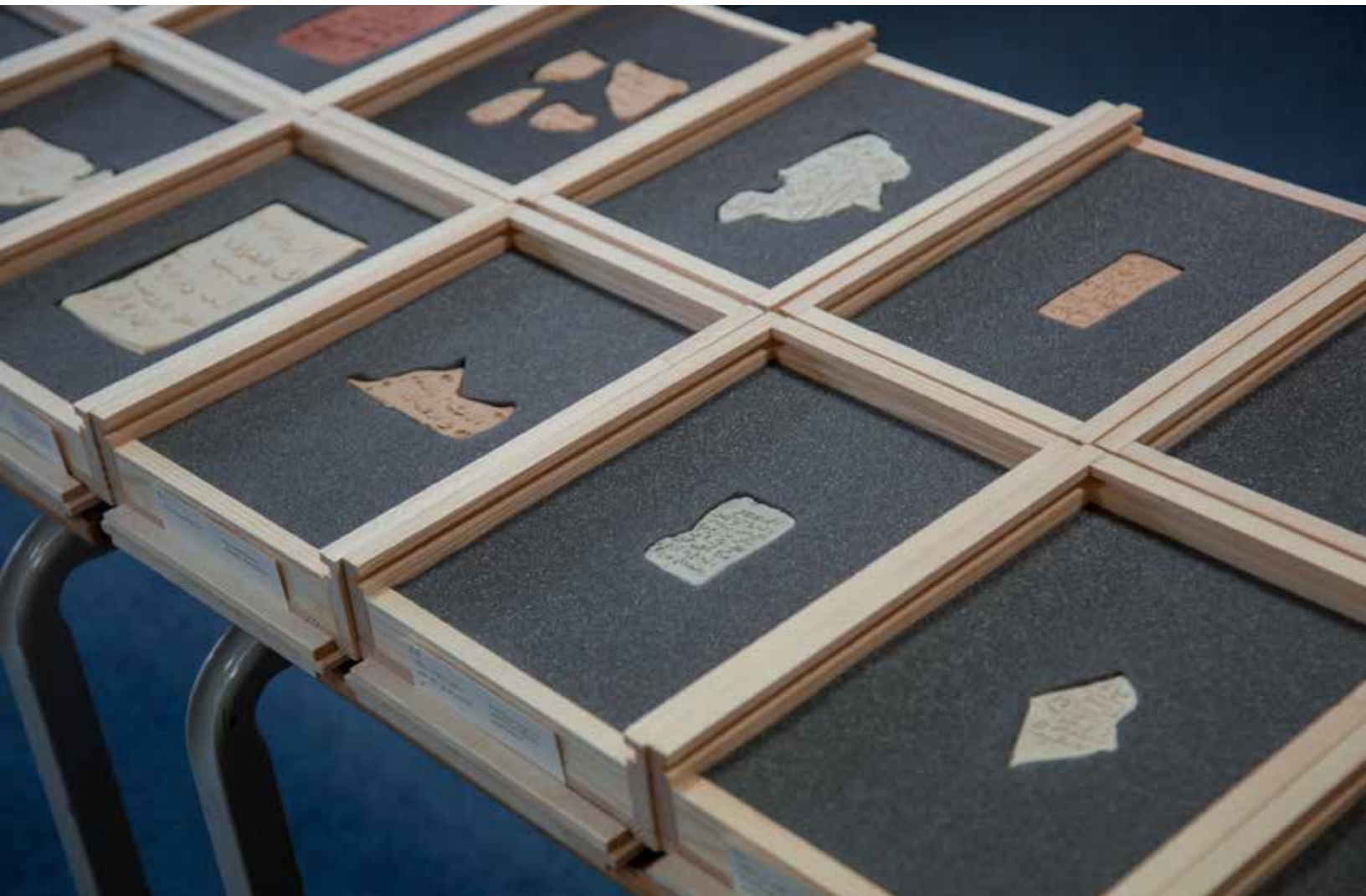
Objects removed for study, 2018. Iraqi Association of London, Inglaterra.