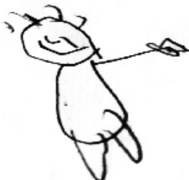
Figura 1. Dibujo realizado por un estudiante con discapacidad intelectual.