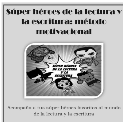
Figura 4. Portada de la cartilla, con los súper héroes seleccionados por los estudiantes.

Todo lo anterior se derivó de algunas de las principales cualidades identificadas en los métodos MACPA, Esperanza y Lectodown que fueron analizados y arrojaron las herramientas clave, para el diseño de la cartilla motivacional para estudiantes con discapacidad intelectual, cuyo objetivo principal fue generar en los estudiantes con discapacidad intelectual leve, la motivación indispensable para abordar la lectura de cuentos y el trabajo de ejercicios, que potenciaron los procesos de lectura y escritura, además, el fortalecimiento de los dispositivos básicos de aprendizaje. A partir de cuentos y actividades relacionados directamente con 5 personajes de súper héroes representativos y llamativos para los niños, los cuales fueron seleccionados, por los propios estudiantes a través de una de las encuestas aplicadas sobre su percepción de intereses. (Ver figura 4)