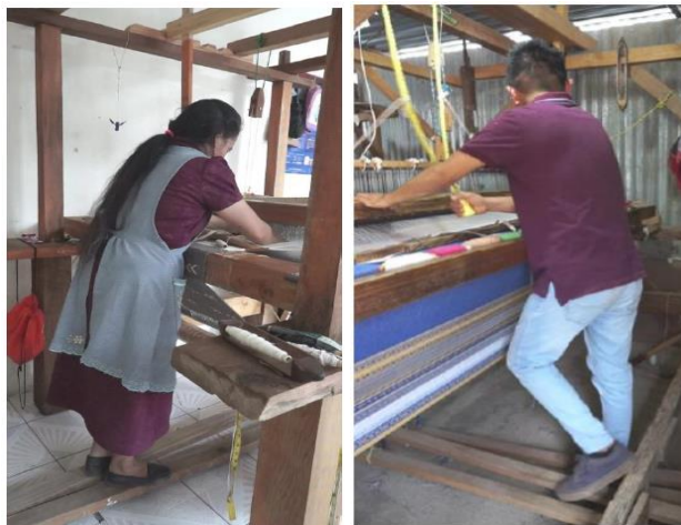
Figura 1. Artesana en telar de pedal (izquierda) y artesano en telar de pedal con chicote (derecha).

En este estudio se analiza la actividad de tejido en telar de pedal y telar de pedal con chicote. El telar de pedal, también conocido como telar colonial o español es una estructura de madera que se destaca por su diseño simple pero eficaz (Fernández Barrera, 1965). Se cree que los artesanos indígenas buscaron ajustar y perfeccionar el diseño del telar de pedal para atender sus necesidades de producción, una de estas mejoras fue la introducción del chicote; un sistema de cuerdas unido a un soporte central del telar que al tirar de este pone en movimiento la lanzadera, herramienta que traslada el hilo de un extremo a otro formando la trama del tejido. Así es como el chicote permite mayor precisión y volumen en la fabricación de textiles. La principal diferencia entre los dos telares radica en el chicote y en el número de pedales, el telar de pedal cuenta con un promedio de dos pedales mientras que el telar de pedal con chicote cuenta con cuatro pedales (Figura 1).