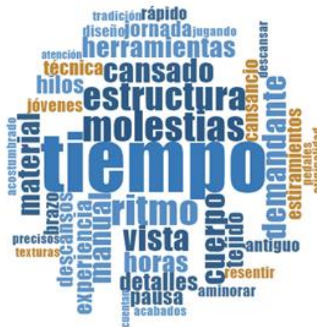
Figura 2. Nube de palabras.

El testimonio de los artesanos proporciona una visión sobre las experiencias diarias, esenciales para comprender aspectos relacionados con su salud y el contexto laboral. De este análisis se obtuvo la siguiente Nube de palabras a través del software NVivo 11, (Figura 2). La nube de palabras permitió visualizar los conceptos más repetitivos (representados por las palabras de mayor tamaño) durante el discurso de los artesanos, este gráfico ayudó a visualizar y resaltar aquellos factores implicados en la actividad de tejido.