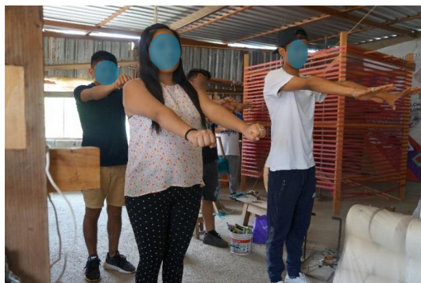
Figura 5. Taller de Pausas Activas con artesanos de TPC.

En el Taller de Pausas Activas participaron 6 artesanos de TPC y 5 del grupo TP, véase Figura 5. El taller fue evaluado por los artesanos a través de un cuestionario de 10 preguntas, de los 11 participantes solo uno experimentó dificultades con un ejercicio debido a las instrucciones un poco confusas, sin embargo, la mayoría evaluó positivamente la información brindada, el tiempo asignado a cada actividad del taller y los ejercicios físicos realizados.